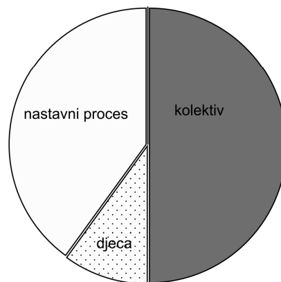
Grafički prikaz 1. Glavne skupine problema s kojima se u praksi susreću pomoćnici

Polovica problema s kojima se susreću pomoćnici odnose se na interpersonalne relacije, slijede problemi u samom nastavnom procesu i, iznenađujuće, problemi u odnosima s djecom (učenicima). Potonje se može tumačiti u kontekstu osposobljavanja, selekcije i praćenja, gdje pomoćnici trebaju imati jasnu sliku s kojom će populacijom raditi, koje su potrebe učenika s teškoćama u razvoju, a kada pomoćnik i naiđe na problem u komunikaciji s učenikom, da im se oboma pruži podrška. Animizitet prema učeničkim ponašanjima lako može odvesti u neprimjerno postupanje, ali i zlostavljanje, što svakako treba prevenirati.