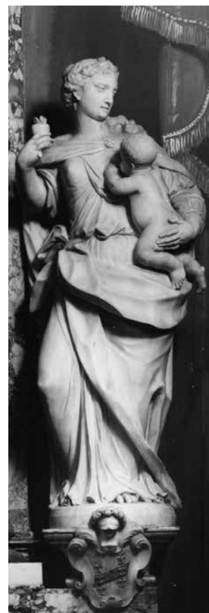
G. M. Morlaiter, Djevičanstvo i Poniznost , oltar Marijina prikazanja u hramu, Dubrovnik, crkva sv. Ignacija