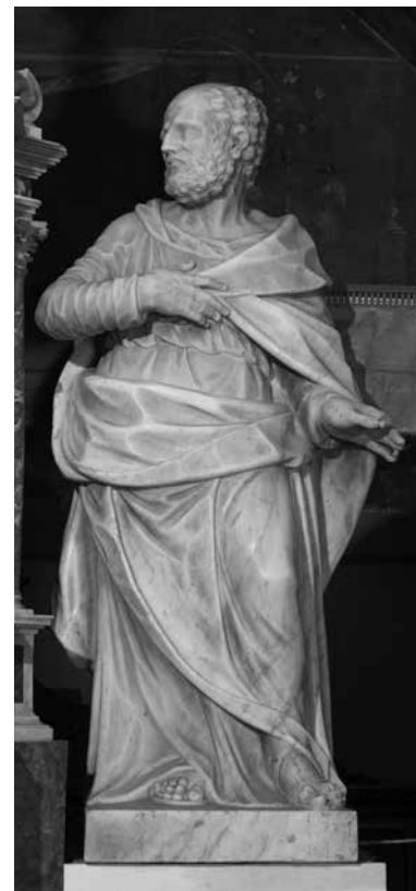
Sv. Josip , ž. c. Uznesenja Bl. Dj. Marije, Katuni (Omiš)

Main altar, parish church of the Assumption of the Blessed Virgin Mary, Katuni (Omiš)