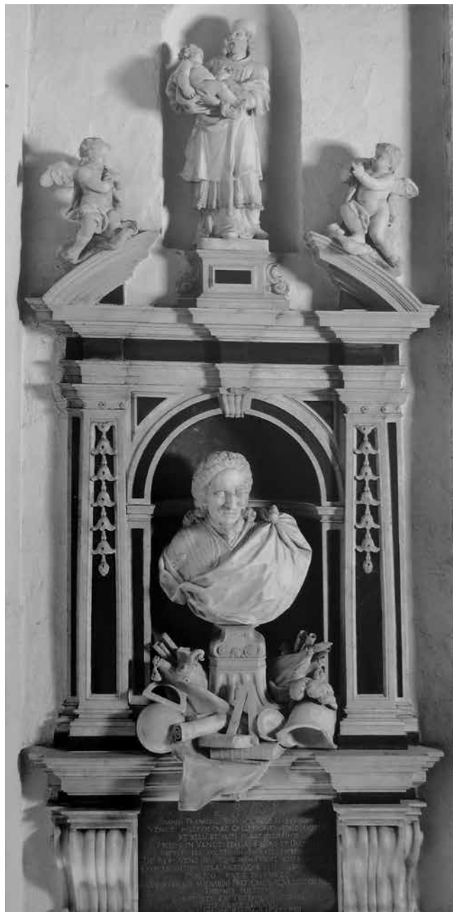
G. M. Morlaiter, Grobnica F. Rossinija, crkva sv. Šime, Zadar G. M. Morlaiter, Tomb of F. Rossini, St Simon's church, Zadar

Morlaiter je višeputno izrađivao u glini i terakoti bozzette i modele. Tako je i za Rossinijev portret izradio gipsani