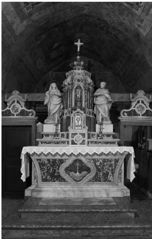
Glavni oltar, ž. c. Uznesenja Bl. Dj. Marije, Katuni (Omiš)

Madonna, parish church of the Assumption of the Blessed Virgin Mary, Katuni (Omiš)