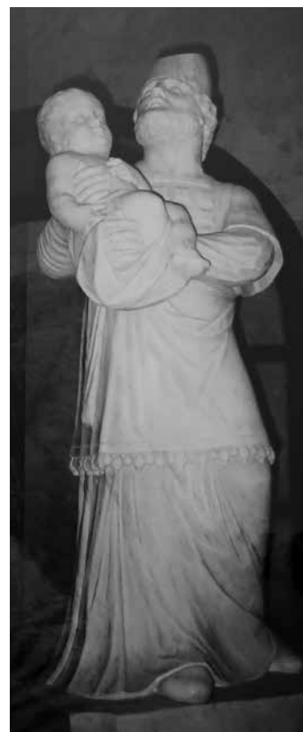
Kipovi sv. Ane i sv. Šimuna, župna crkva Očišćenja Bl. Dj. Marije, Dol, otok Brač

Statues of St Anne and St Simon, parish church of the Purification of the Blessed Virgin Mary, Dol on the island of Brač