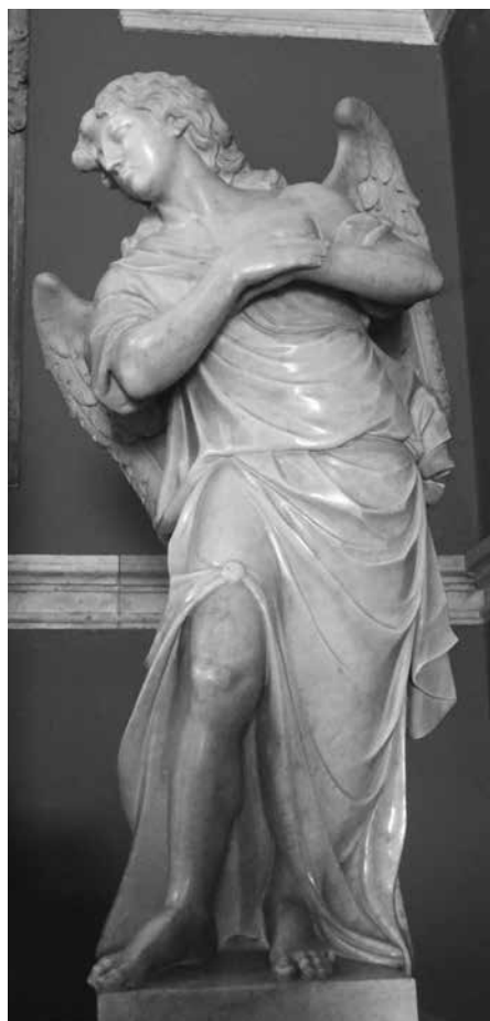
Andeli s oltara sv. Vincence, župna crkva Svih Svetih, Blato na Korčuli Angels from the altar of St Vincenca, parish church of all Saints, Blato on the island of Korčula

e fatura in tutto Ducati settantasei che son Lire quatro cento sattantadue è soldi quatro dico 471-4 Riceutti in tre volte lire tre cento e novanta tre dico 393:- Resta 78:4 30 ottobre 1746 Ve.tia