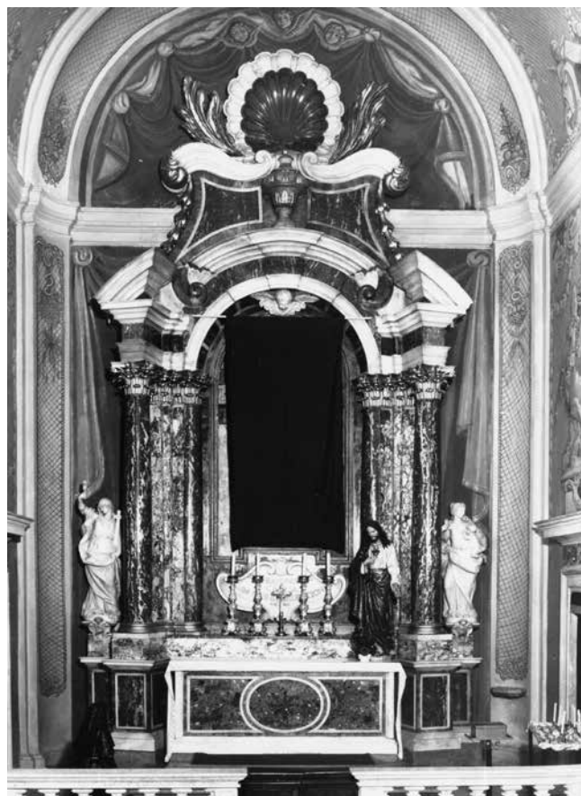
Oltar sv. Augustina, Dubrovnik, crkva sv. Ignacija Altar of St Augustine, Dubrovnik, St Ignatius' church

zadržala i u kasnom razdoblju, pa i onda kada je, pritisnut godinama i brojnim narudžbama, dio posla prepuštao suradnicima u radionici.