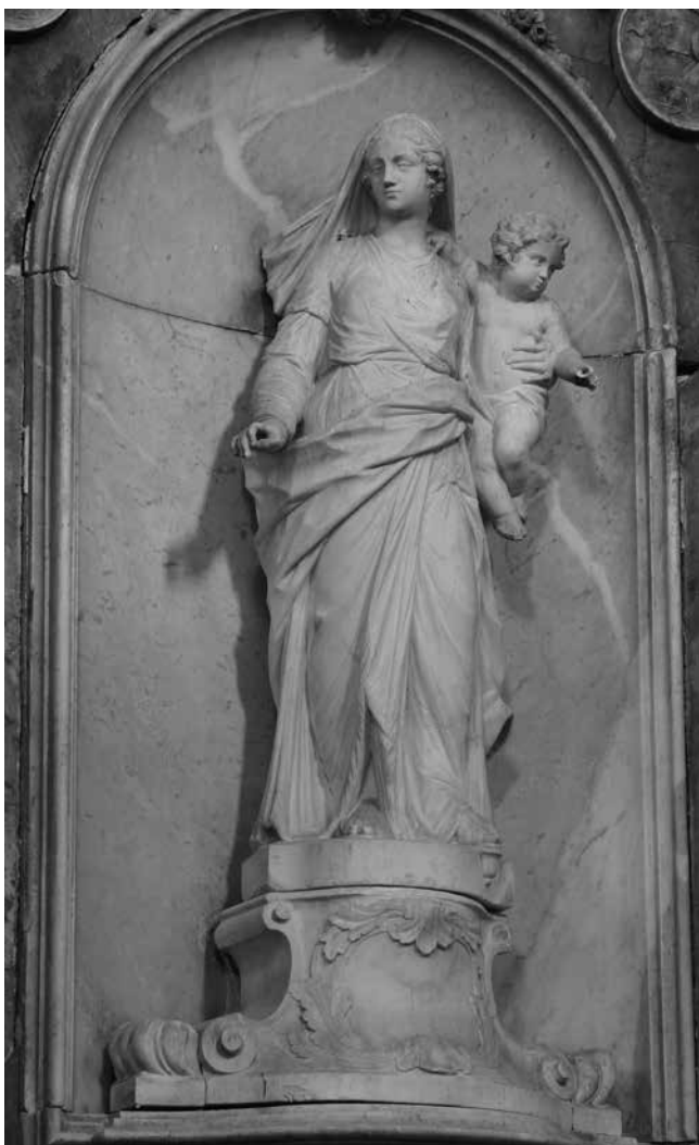
Gregorio Morlaiter, Gospa od Presvetoga Ružarija , oltar Gospe od Ružarija, crkva sv. Eustahija, Dobrota

Gregorio Morlaiter, Our Lady of the Holy Rosary, altar of Our Lady of the Rosary, St Eustace's church, Dobrota