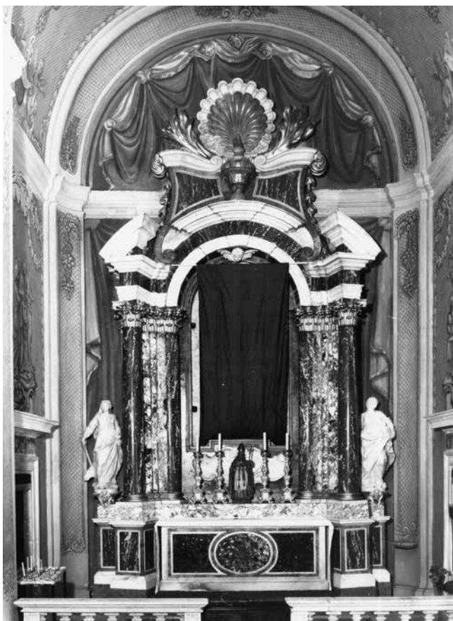
Oltar Marijina prikazanja u hramu, Dubrovnik, crkva sv. Ignacija Altar of Mary's presentation in the Temple, Dubrovnik, St Ignatius' church