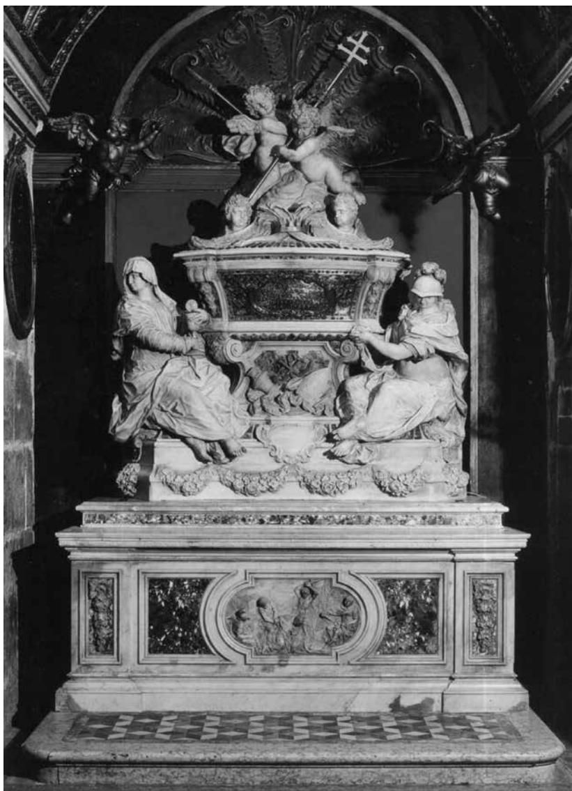
G. M. Morlaiter, oltar sv. Dujma, katedrala sv. Duje, Split G. M. Morlaiter, altar of St Doimo, Split, cathedral

1750. i 1755. godine. Tamošnji je oltar nastao prema zamisli arhitekta Giorgia Massarija s kojim je Morlaiter veoma često surađivao na brojnim projektima. On je složenije dekoracije jer uključuje reljefe u pozlaćenom srebru na predoltarniku, ugaonim pilastrima te na vratnicama svetohraništa, vrste mramora su brojnije i dragocjenije, a modelacija anđela klesanih u mramoru iz Carrare studioznija. 23