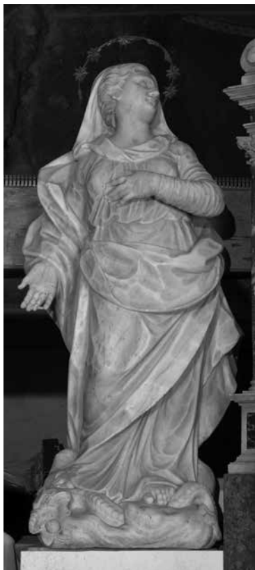
Bogorodica , ž. c. Uznesenja Bl. Dj. Marije, Katuni (Omiš)

Madonna, parish church of the Assumption of the Blessed Virgin Mary, Katuni (Omiš)