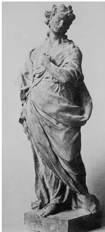
G. M. Morlaiter, Modeli za anđele na glavnom oltaru u crkvi sv. Marije u Zadru, Ca'Rezzonico, Venecija G. M. Morlaiter, Models for angels at the main altar of St Mary's church in Zadar, Ca'Rezzonico, Venice

sa slikarstvom G. B. Pittonija. Taj slikarski karakter njegovih djela, u prvom redu reljefa koje je često radio, davno je prepoznao Giulio Lorenzetti okrstivši ga kao un Pittoni scultore koji je sposoban natjecati se u svojim brojnim bozzettima s mrljastim slikarstvom di un Guardi figurista . 21