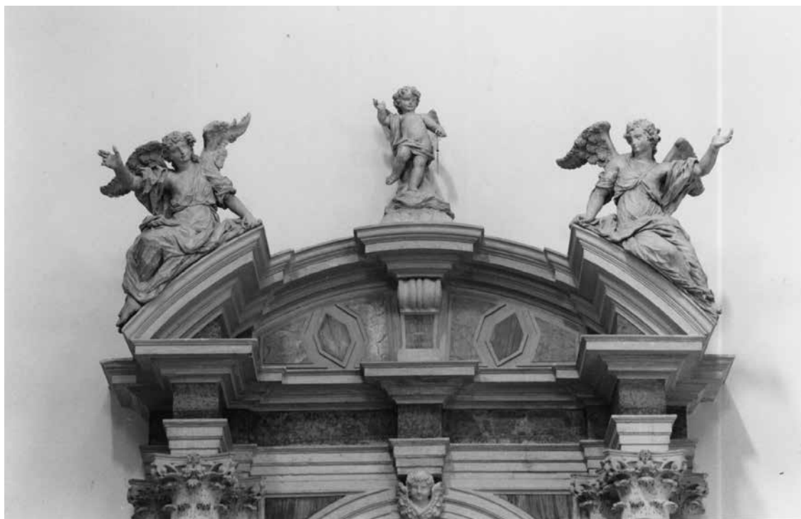
G. M. Morlaiter, anđeli, oltar Gospe od Ružarija, Prčanj, župna crkva Rođenja Blažene Djevice Marije G. M. Morlaiter, Angels, altar of Our Lady of the Holy Rosary, Prčanj, parish church of the Nativity of the Blessed Virgin Mary

apostolski učenik sv. Dujam, osiguravali su splitskoj crkvi povlašten položaj u Dalmaciji, jer takav legitimitet i takvu starinu druge crkvene zajednice i biskupije od Kotora do Zadra nisu imale. Oltar objašnjava i tumači smisao Dujmove žrtve: od mučeničke smrti koju je podnio za kršćanstvo, a prikazana je u reljefu na predoltarniku, njegova se sudbina transformira. Postojanom i jakom vjerom on je od mučenika koji je žrtvovao vlastiti život postao svetac na čijem se uzoru stoljećima gradila nadbiskupska, metropolitanska crkvena zajednica u Splitu. Na menzi stoga i sjede alegorijske figure Vjere i Jakosti koje nose urnu sa svečevim relikvijama dok su u podnožju i na poklopcu simboli Dujmove nadbiskupske časti. Njegovu mučeničku smrt i žrtvu koju je podnio za kršćanski nauk potvrđuju savijene palmine grane između glavica anđela na vrhu sarkofaga.