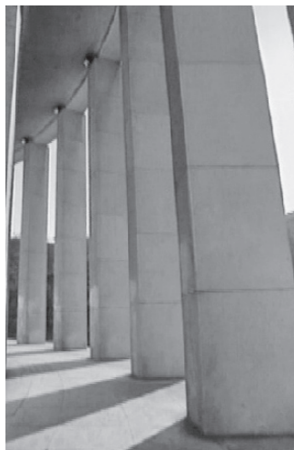
Lijevo: V. Richter: Kotarska uredska zgrada, Zelina, 1953.- 4. (detalj glavnog pročelja)