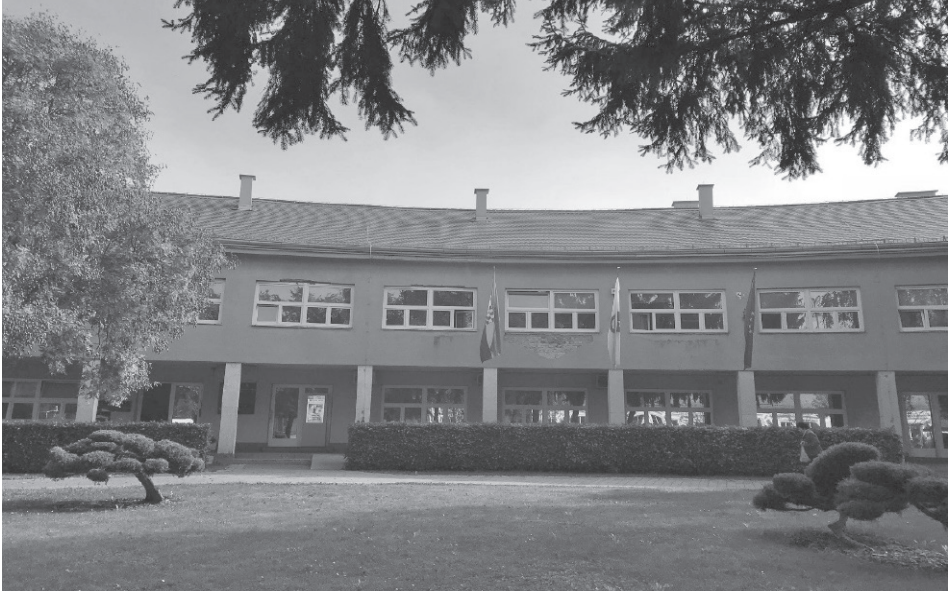
Zgrada Gradskog poglavarstva, 2017.

Muzeja evolucije u Krapini (1966.), kojega je pred sedam godina realizirani Muzej krapinskih neandertalaca Ž. Kovačića, tlocrtno govoreći, izravni nasljednik.