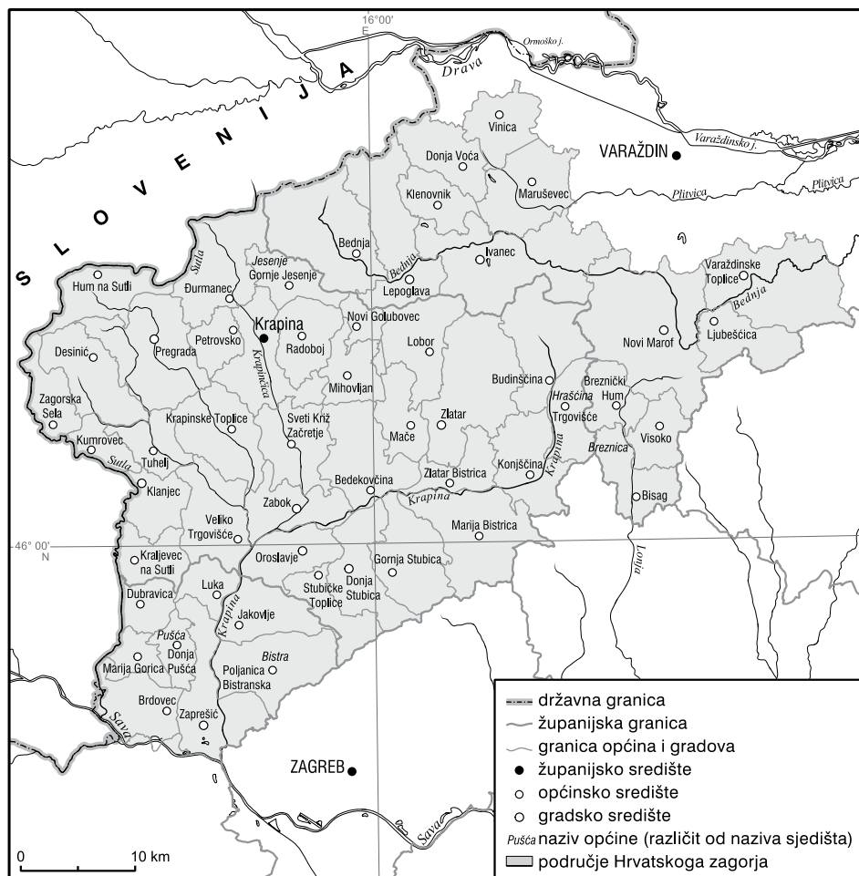
Slika 4. Karta upravne podjele zagorskoga područja

kle, prilagodili političkim granicama. Oko Krapinsko-zagorske županije nije bilo nikakvih dvojbi, po svim dosad spomenutim autorima nju je trebalo uključiti u cijelosti. U Varaždinskoj županiji bilo je potrebno odrediti koji će se njezin dio smatrati sastavnim dijelom Zagorja, dok se u Zagrebačkoj županiji trebalo odlučiti hoće li se uključiti njezin sjeveroistočni dio, koji se nalazi sjeverno od Save i Medvednice. U Varaždinskoj smo županiji izdvojili i uključili one dijelove tj. općine (gradove) koji udovoljavaju krajobraznome opisu, dok smo izostavili one općine koje obuhvaćaju nizinsko pridravsko područje (slika 4). Gledano od zapada prema istoku, prvo smo bez imalo dvojbe uključili općine Bednja i Klenovnik te gradove Ivanec i Lepoglavu. Nešto više dvojbe bilo je oko općina koje se nalaze istočnije od spomenutih, jer su one po svom položaju granične unutar zagorskoga područja. Ako se taj rubni niz općina