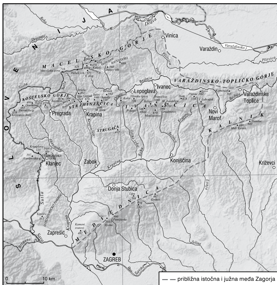
Slika 3. Karta zagorskoga područja s prirodnim međama

zadaća uredništva Enciklopedije Hrvatskoga zagorja bila je da područje svojega zanimanja omeđi u skladu s najširim od izloženih koncepcija, a da se pritom ipak pokuša držati makar nekih čvrstih kriterija. Do konačnoga odgovora na pitanje što je Hrvatsko zagorje, došli smo u dva koraka. U prvome smo spoznaje iz literature promotrili na zemljovidu i okvirno iscrtali približnu među s obzirom na državnu granicu i glavne prirodne sadržaje, a u drugome smo tu crtu »korigirali« s obzirom na postojeće granice manjih upravnih cjelina, općina i gradova. Promatrano u cijelosti (slika 3), zagorsko je područje na zapadu, a djelomice i na sjeveru, jasno omeđeno rijekom Sutlom, koja je ujedno i današnja državna granica. Štoviše, rijeka Sutla nije samo današnja granica nego je stara hrvatsko-štajerska pokrajinska granica, jedna od najdugotrajnijih i najstabilnijih političkih granica u Europi. Sutla je granična rijeka go-