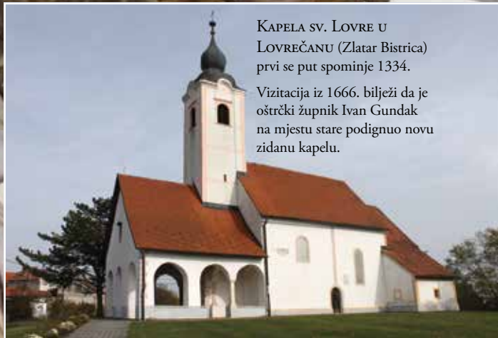
KAPELA SV. LOVRE U LOVREČANU (Zlatar Bistrica) prvi se put spominje 1334.