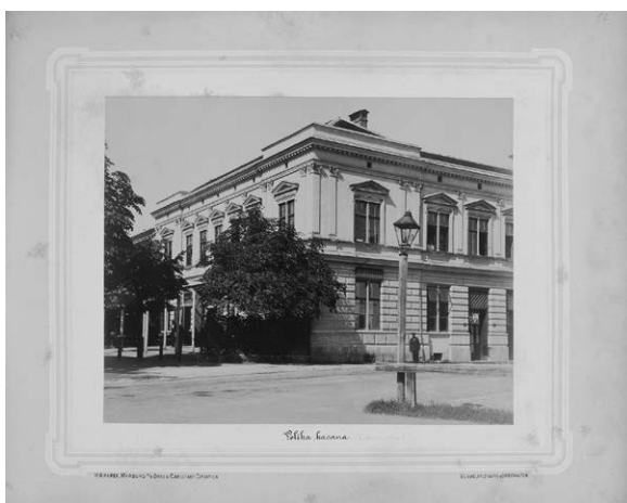
Slika 3. Različiti potpisi pod istim fotografijama (GMK-KP-363, HR-HDA-1435-1, Ministarstvo kulture RH, Uprava za zaštitu kulturne baštine, Specijalna knjižnica)