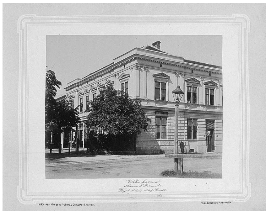
Slika 4. Tekst posvete dr. Gustavu Kornitzeru (HR-HDA-1435-1)

Primjerak albuma koji se čuva u Hrvatskom državnom arhivu dimenzija je 32,7 x 40,5 x 3,6 cm uvezen u crvenu kožu na kojoj je zlatotiskom otisnut naslov Grad Karlovac i njegova okolica također sadržava 24 fotografije formata približno