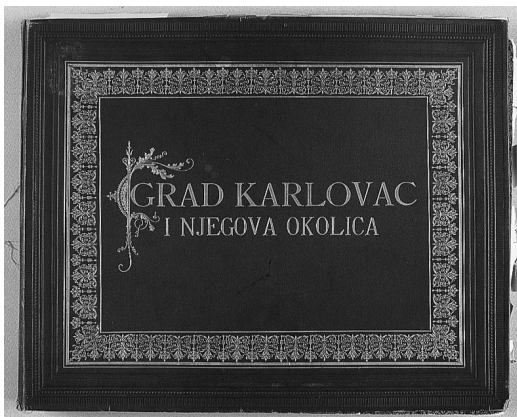
Slika 2. Korice albuma (GMK-KP-363)

Za drugi album u vlasništvu Gradskog muzeja Karlovac, inv. oznake GMK-KP-363, nije jasno kada i na koji način je ušao u fundus muzeja. Dimenzije su mu 33 x 41 x 3,6 cm. Ima smeđi kožni uvez na kojem je zlatotiskom u bogato ukraše-