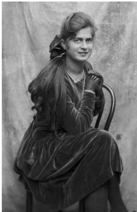
Slika 7. Djevojka u baršunu, ploča 9 x 12 cm, izrez (DADU-SCKL-551. Zbirka fotografija Jakova Peručića. 1.2. Negativi prema izvornim fotokutijama, kutija 38)