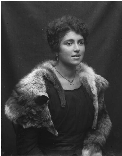
Slika 9. Djevojka s krznom, ploča 7 x 9 cm, izrez (DADU-SCKL-551. Zbirka fotografija Jakova Peručića. 1.2. Negativi prema izvornim fotokutijama, kutija 2)

Kako za sada imamo sačuvane samo negativne i tek nekoliko pozitiva, ne možemo suditi što je na negativima Peručić izabirao, kakve izreze je radio i kako je izrađivao pozitive (kontaktnim kopiranjem ili povećavanjem). S obzirom na to da je na većini negativa prema rubovima slike okolina nereprezentativna, vjerojatno