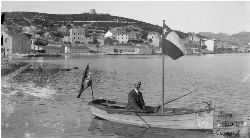
Slika 3. Fotograf Peručić u istočnom Borgu Korčule, ploča 13 x 18 cm, puni format (Privatna zbirka Vicko Ivančević)

nebu otvorenim prostorima kuće na zapadnoj strani grada te po dvorištima kuća u gradu i okolici. Negativi koji se mogu povezati s razdobljem austrougarske vlasti, snimljeni su na popločanom otvorenom prostoru pokraj pucala bunara kojeg nismo uspjeli identificirati. Manji dio negativa snimljen je na stubištu također nepoznate lokacije. Najveći dio negativa snimljen je u stambenom sklopu Tabain (Golubović) 25 ponad današnjeg hotela Korčula i uz crkvicu sv. Barbare. Dandanas se može identificirati nekoliko točnih mikrolokacija u tom sklopu, s obzirom na to da se kuća od početka 20. stoljeća nije mijenjala (osim što je propadala). Jedna od tih mikrolokacija bila je uz sporedni ulaz kuće u današnjoj ulici Vinka Foretića. Uz taj ulaz i unutrašnje stubište snimao je Peručić već od austrougarskog razdoblja (portret s dječjom mornarskom kapom s nazivom austrougarskog ratnog broda), a najviše za vrijeme talijanske okupacije (1918.–1921.). U naravi taj je prostor poprilično skućen, ali bi on u njega strpao i sedmeročlane obiteljske grupe. Na terasi kompleksa do kojeg vodi spomenuto stubište, kao drugoj mikrolokaciji u tom stambenom sklopu, znao je postavljati i veće grupe. Na znatnom dijelu negativâ vidi se još jedna uska neidentificirana lokacija. Na tim se snimkama na zidu impro-