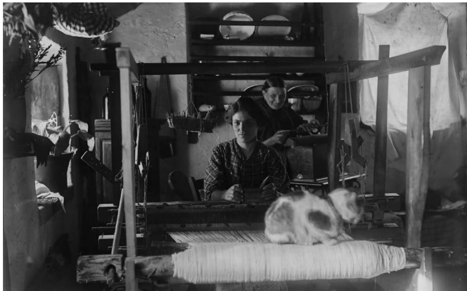
Slika 4. Majka i sestra Rozina za tkalačkim stanom