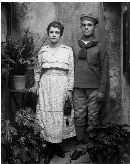
Slika 8. Djevojka s fincom, ploča 9 x 12 cm, puni format (DADU-SCKL-551. Zbirka fotografija Jakova Peručića. 1.1. Negativi prema formatima, omot 12II)