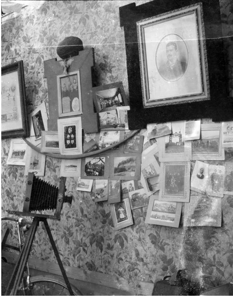
Slika 2. Atelijer u Čileu, folija 7 x 9 cm, puni format (DADU-SCKL-551. 2. Negativi na nitro-celuloznoj podlozi)

kasnije. Sačuvani negativi s prizorima Punta Arenasa svjedoče o vremenu širenja naselja. Iz njih izbija vitalnost sredine u usponu. Niz negativa prikazuje svečano otvaranje pojedinih novootvorenih (trgovačkih?) objekata, novootvoreni hotel Aike (?) (prema obližnjemu geografskomu predjelu?), prvu vožnju vlaka tramvaja na uskotračnoj pruzi avenije Colón.