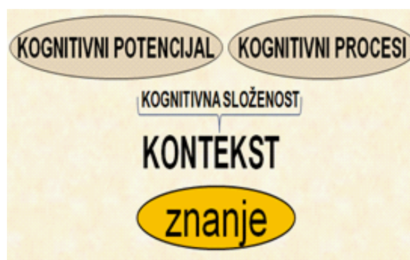
Slika 1. Prikaz stjecanja znanja kognitivnim sposobnostima i kontekstom

Odgovore na ova pitanja, pokušalo se dati kroz provedeno istraživanje kojim se usmjerilo na raščlambu i spoznaje koje se mogu primijeniti na prezentacijsko sredstvo kojim se služi poučavatelj i kojim se želi doprijeti do povratne reakcije poučavanih, [4].