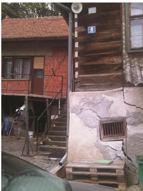
Slika 9. Oštećenja na objektima izgrađenim na klizištu u Glavnici Gornjoj