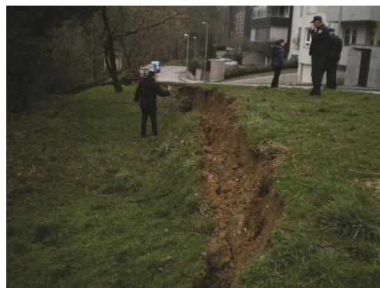
Slika 6. Klizište u Istarskoj ulici