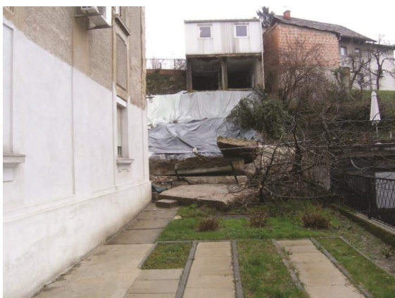
Slika 8. Destabilizacija tla i srušeni zid u ulici Sv. Duh