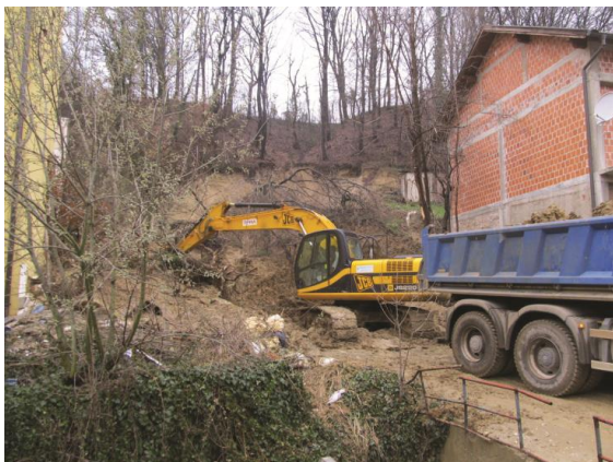
Slika 7. Klizište u ulici Črnomerec. Izvođenje radova hitne sanacije