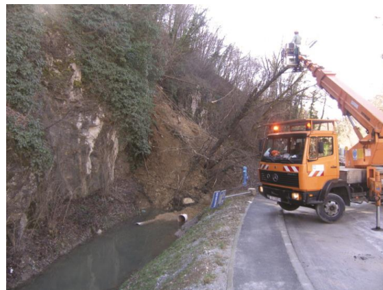
Slika 10. Klizište u ulici Sutinska Vrela. Hitne mjere sanacije