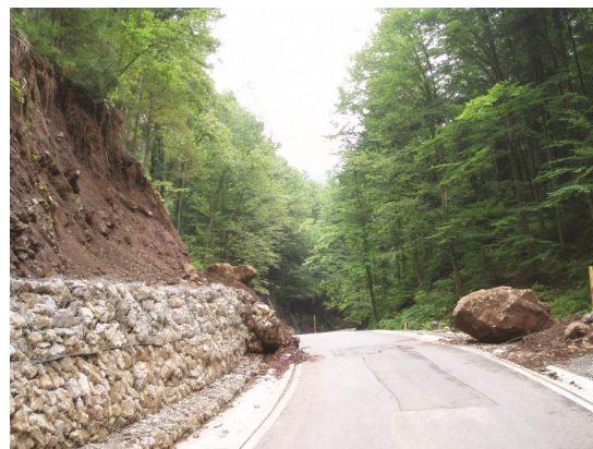
Slika 5. Odron na sljemenskoj cesti