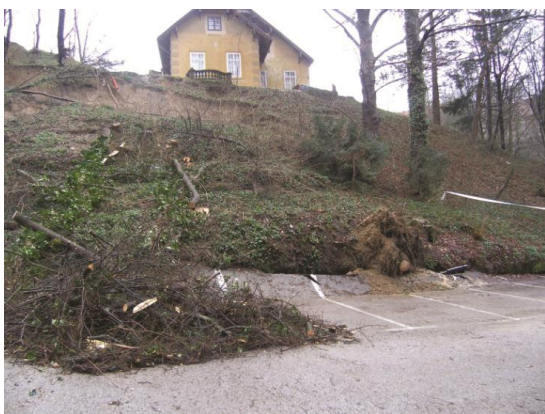
Slika 2. Klizište u ulici Dubravkin put