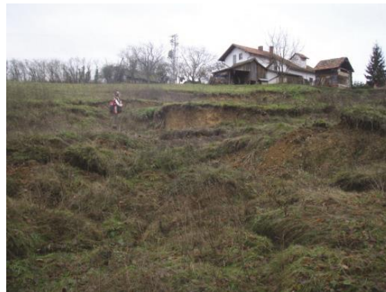
Slika 12. Klizište u Novskoj