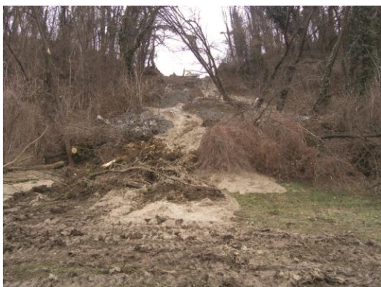
Slika 1. Blatni tok u Vinobreškoj ulici u Zagrebu