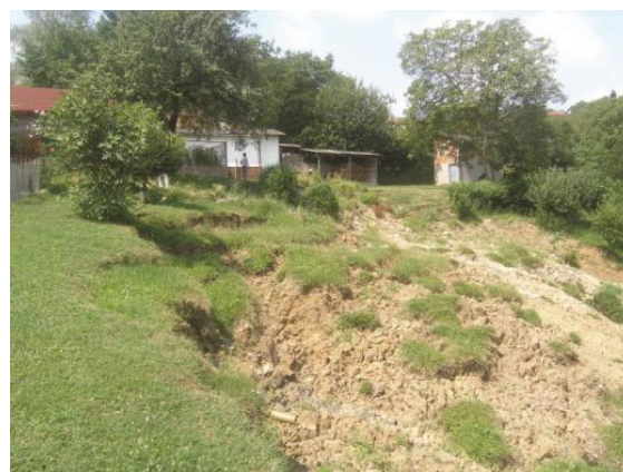
Slika 11. Klizište u Slavenskom Brodu