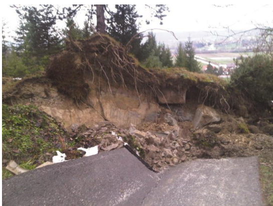
Slika 3. Klizište na cesti za Mariju Goricu