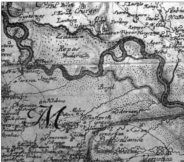
Slika 1. Dio Podravine na karti Ignatia Müllera iz 1769. godine (HDA, Kartografska zbirka, sign. DXIV.5)

Povijest nekih naselja uz desnu obalu rijeke Drave u koprivničko-đurđevečkom dijelu Podravine dobro je zastupljena u hrvatskoj historiografiji zahvaljujući prvenstveno Dragutinu Feletaru i Hrvoju Petriću koji su objavili monografska djela o Torčecu 2 , Drnju 3 i Đelekovcu 4 i druge radove koji sadrže vrijedne podatke i o naseljima Botovo, Sigetec i Hlebine. Mnogo je objavljenih podataka i o odnosu naselja Molve s rijekom Dravom. 5 Povijest Prekodravlja, prvenstveno naselja Gola, dobro je poznata zahvaljujući vrijednome istraživaču, piscu i slikaru Ivanu Večenaju (1920.-2013.) koji je objavio više knjiga s podacima o naseljavanju Prekodravlja. 6 Mnogo radova o naseljima uz desnu obalu rijeke Drave nalazi se u časopisu za multidisciplinarna istraživanja Podravina i časopisu za gospodarsku povijest i povijest okoliša. Vrijedni istraživači dali su doprinose poznavanju prošlosti spomenutih naselja tako što su predstavili i interpretirali različite povijesne izvore, pisali o različitim aspektima prošlosti prostora i stanovništva (povijest okoliša, gospodarska i kulturna povijest, demografija), dali preglede geografskih obilježja i drugo. Neki od autora su Dragutin Feletar, Hrvoje Petrić, Mirela Slukan Altić, Željko Holjevac, Drago Rokandić, Mira Kolar-Dimitrijević, Mladen Matica, Vladimir Šadek, a u posljednje vrijeme Željko Krušelj koji objavljuje o poplavama u 20. stoljeću. Popis diplomskih i drugih radnji s ovom