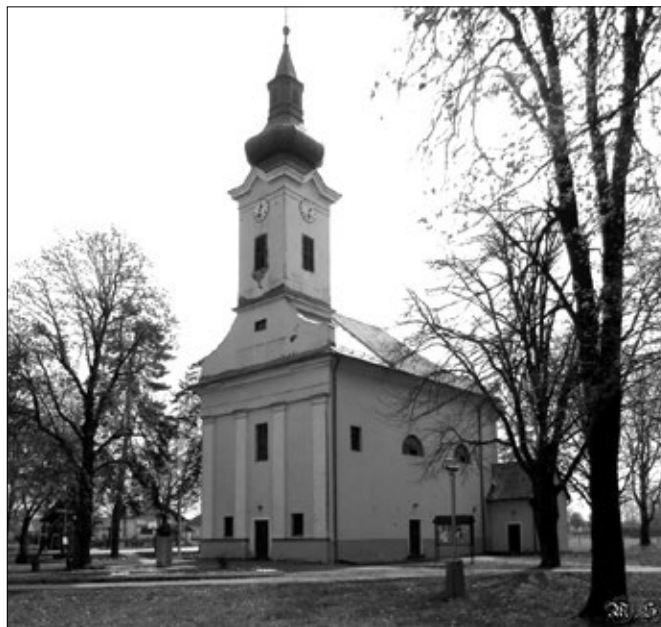
Slika 3. Pogled na župnu crkvu u središtu Ferdinandovca