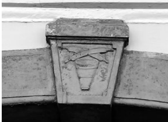
Foto 1: Strojarski cehovski znak v Dravski ulici 8 na Ptuj.