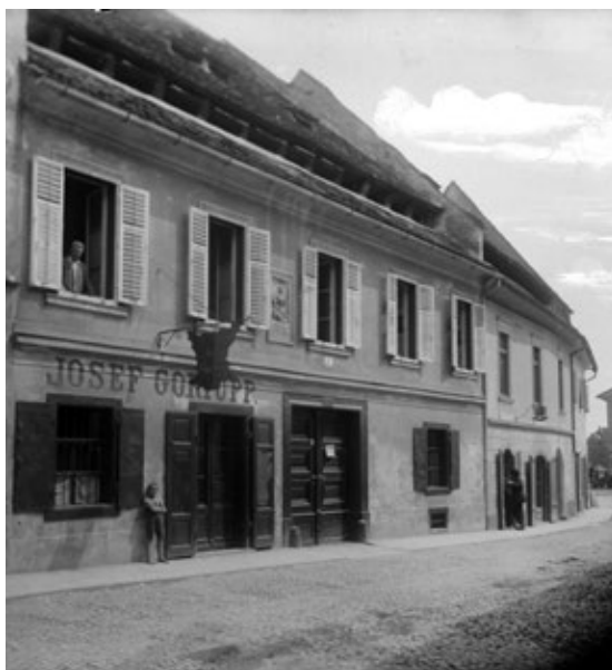
Foto 3: Stavba usnjarskega mojstra Josefa Goriuppa v Cankarjevi ulici na Ptuj, pred 1941.