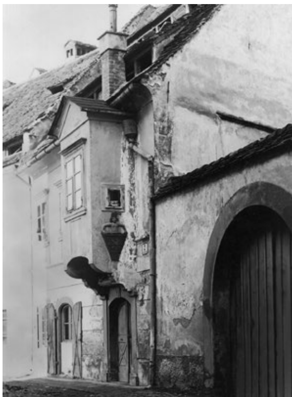
Cehovska hiša ptujskih usnjarjev v Dravski ulici. Uničena je bila v enem izmed devetih bombnih napadov na Ptuj med januarjem in marcem 1945.

jetju v meščanski stan je občina novemu meščanu izdala meščanski list. Na osnovi statuta iz leta 1877 je občina od prosilca oziroma kandidata zahtevala za podelitev meščanske pravice pristojbino, ki je lahko znašala največ 20 goldinarjev. To pristojbino so namenili za delovanje splošne javne meščanske bolnišnice. 9