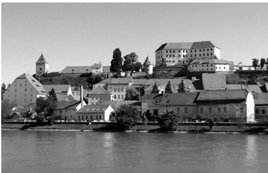
Foto 8: Veduta Ptuja. Prostor, kjer je v 20. stoletju stala Pirichova usnjarna je v prvem desetletju 21. stoletja postalo parkirišče.