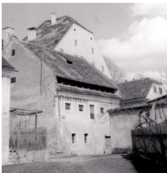
Foto 4: Stavba usnarja Franza Potočnika v Zgornji dravski ulici na Ptuj, začetek 20. stoletja.

goveje, svinjske in telečje kože in izdeloval iz različnih kož takratno sodobno modno usnje. Čevljarjem pa je prodajal usnje iz različno izdelanih kož in druge čevljarске pripomočke. 29