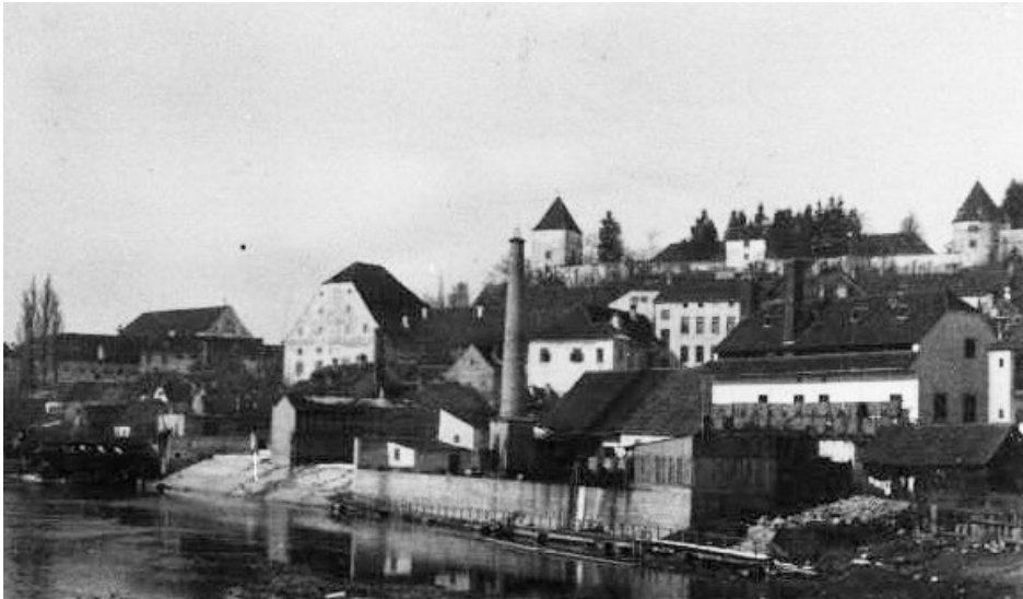
Foto 5 Pogled na Usnjarno Pirich z vidnim zaščitnim zidom ob Dravi po letu 1905.

je bila po upravni razdelitvi samostojna krajevna občina) zgradili novo tovarno, ki je nastala na njihovem zemljišču, pridobljenem z nakupom leta 1898. Nova tovarna usnja z imenom Josef Pirich, Lederfabrik in Pettau je bila v register vpisana 5. 10. 1907. 33 Poslovala je le do leta 1912, ko je bila zaradi stečaja ukinjena, 34 iz registra pa je bila izbrisana šele 15. 2. 1917. 35