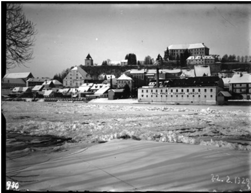
Foto 7: Pogled na Ptuj in usnjarno Pirich, 22. 2. 1929

Pokrajinski muzej Ptuj - Ormož, fotodokumentacija