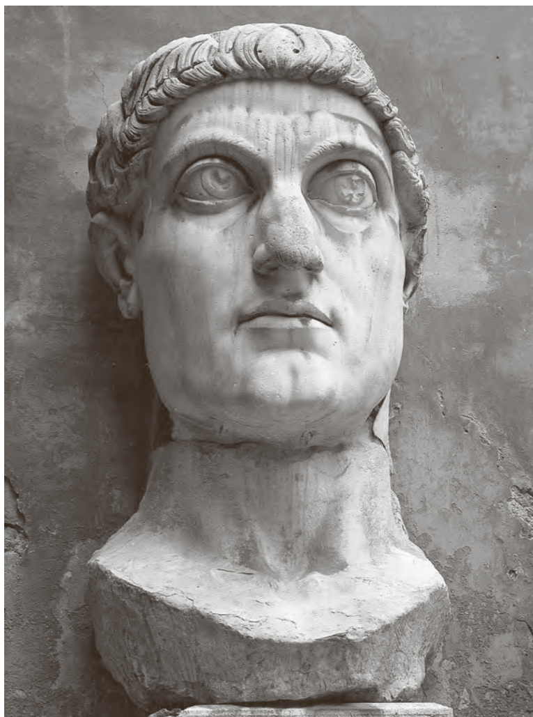
← Glava kolosalnog kipa (smatra se cara Konstantina Velikog), nakon 315., Rim, Palazzo dei Conservatori

Gotovo je uzbudljivo promatrati kako se u vješto koncipiranoj i suvereno potkrijepljenoj argumentaciji likovnost povezuje s društvenim kontekstom, kako iz njega proizlazi i kako ga preobražava.