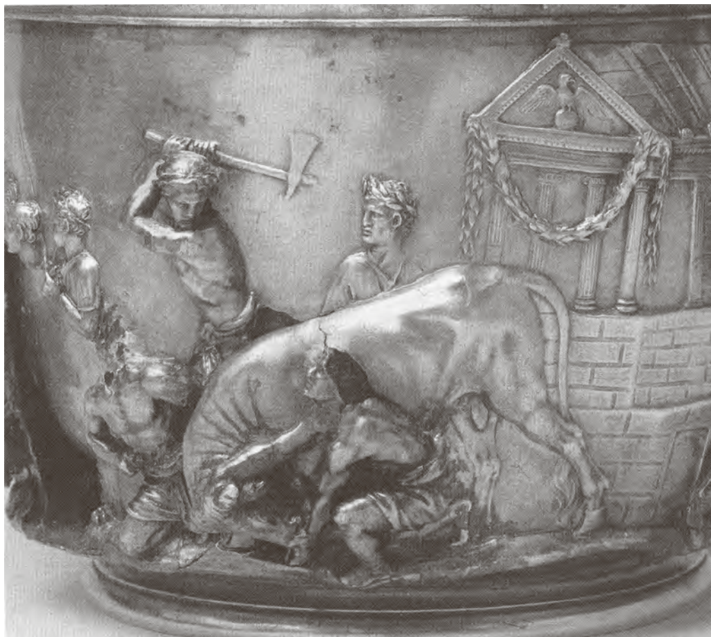
† Srebrni pehar iz Boscorealea (Tiberijev pehar), rano 1. st., Pariz, Louvre

u kojem kršćanstvo, nakon teških progona i postojanja u ilegali, preuzima duhovno vodstvo i postaje okvir za novo razumijevanje svijeta i organizacijska potpora reorganiziranoj političkoj moći velikoga carstva. Novo je vrijeme s novim svjetonazorom tražilo novu semantiku kojoj je umjetnost odgovorila u svim tada raspoloživim medijima.