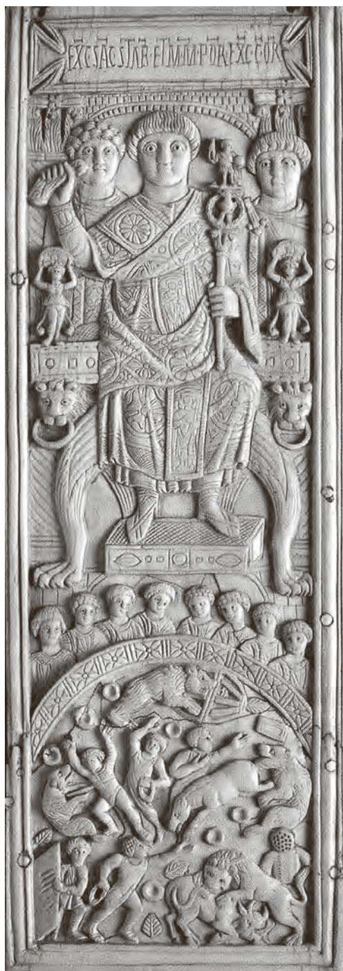
↑ Bjelokosni diptih konzula Areobinda, Konstantinopol, 506., Pariz, Musée de Cluny

U toj dimenziji interpretacije kulture uz pomoć ikoničkih spoznaja Milinovićeve knjiga nadilazi puku ikonografsku analizu i tipološko razvrstavanje sadržaja ranokršćanske umjetnosti. Njezin je domet interpretacijski i sintezni. Ona kroz pojedinačne primjere gradi cjelovit mozaik likovne kulture ranoga kršćanstva, kulture na kojoj počivaju kasnija stoljeća zapadne duhovnosti, ćudoređa i poimanja umjetnosti.