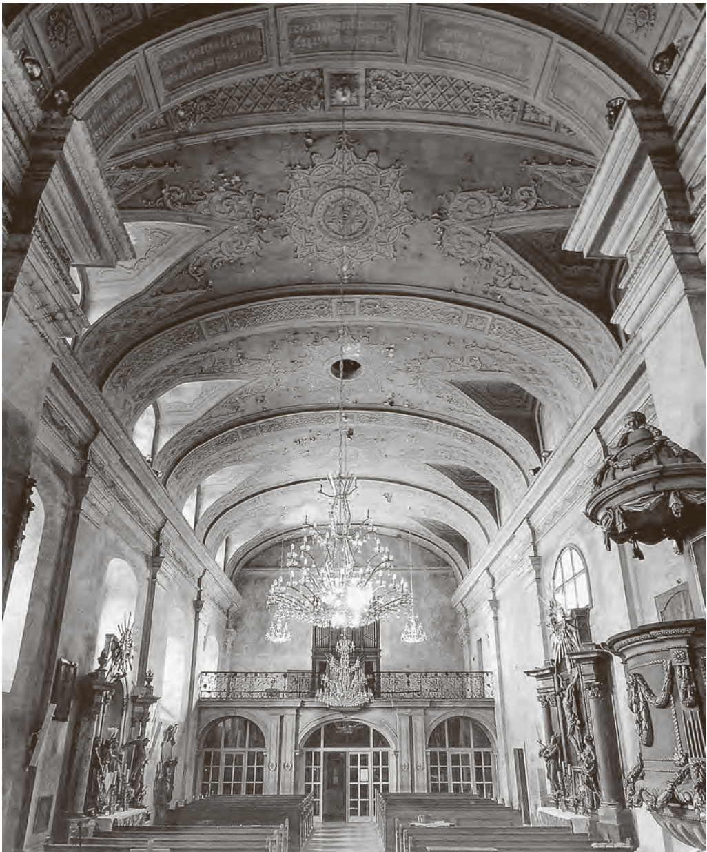
↑ Interijer nekadašnje jezuitske crkve Sv. Jurja u Petrovaradinu, izgrađene 1701. godine.

cjelinu knjige, u kojoj autorica veliku pažnju posvećuje društvenim, političkim i ekonomskim datostima Vojvodine u promatranome vremenskom razdoblju. Nakon osmanskoga povlačenja na samom kraju 17. stoljeća upravo je politička uloga