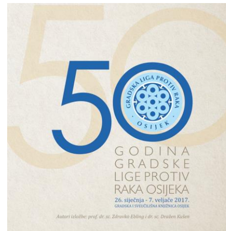
Naslovnica publikacije 50 godina Gradske lige protiv raka Osijek