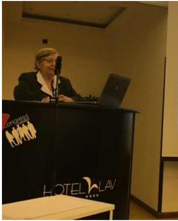
Pozdravni govor dr. V. Bosanac