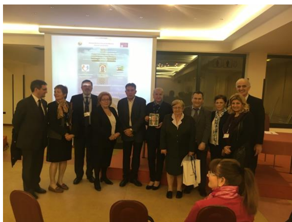
Članovi Organizacijskog odbora, pokrovitelja i uvodničara kongresa

Teme Kongresa bile su: Palijativna skrb pedijatrijskog onkološkog bolesnika, Uloga stomatologa u palijativnoj skrbi onkoloških bolesnika, Važnost ljekarnika u savjetodavnoj funkciji palijativnih bolesnika, Komunikacijske vještine kao temelj dobre palijativne skrbi, Medicinska sestra u palijativnom timu, Duhovna skrb za onkološke bolesnike, Psiholog kao član palijativnog tima, Uloga socijalnog radnika u palijativnom timu, Opće teme s predavanjima istaknutih stručnjaka (Sadašnjost i budućnost onkologije u Hrvatskoj - S. Pleština, Palijativna skrb u sustavu zdravstva RH – V. Vučevac, Palijativna skrb u Nizozemskoj – D. Juriša, Kanabinoidi i palijativni bolesnik – B. Belev, Osnovno ljudsko pravo – palijativna skrb - S. Dološić), Informatizacija palijativne skrbi na razini županije, Okrugli stol – Onkološki palijativni bolesnik između sekundarne i primarne zdravstvene zaštite. Izdana je i knjiga sažetaka prijavljenih radova.