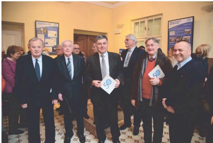
Uzvanici na otvaranju izložbe

Članovi Podružnice Osijek bili su uz Hrvatsko onkološko društvo inicijatori i suautori izrade Nacionalnog programa ranog otkrivanja raka u Hrvatskoj, koji se provodi u Hrvatskoj od 2006. godine.