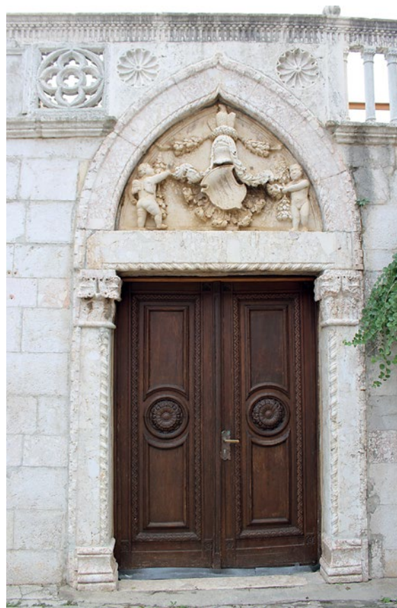
8 Portal palače Nimira

Naime, u gradu se mogu pronaći ugaoni stupići s kapitelima i bazama, no većina njih danas ipak ima ili samo kapitel ili samo bazu. Baze se