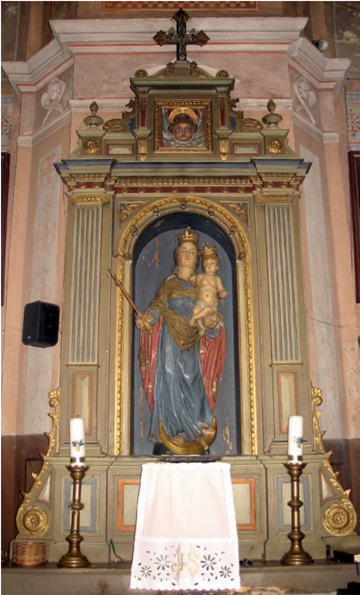
1 Novo Čiče, župna crkva sv. Ivana Krstitelja, oltar Majke Božje

Novo Čiče, parish church of St John the Baptist, Altar of Our Lady