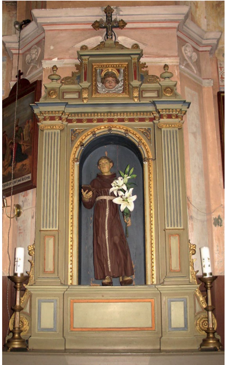
2 Novo Čiče, župna crkva sv. Ivana Krstitelja, oltar sv. Antuna Padovanskog

Od cijelog oltara s raspoređenih šest skulptura danas je sačuvana samo skulptura Bogorodice s Djetetom 12 (sl. 3, 4) koja je smještena u nišu oltara podignutog 1897. godine. Očito je tada bilo odlučeno da se središnja skulptura zadrži, 13 a prema njezinim dimenzijama projektirana je nova oltarna arhitektura u neostilskom duhu na izmaku stoljeća. U novo okruženje skulptura je uklopljena i preslikom, no nije isključeno da je već bila repolikromirana i netom prije, odnosno 1886. godine kada su sva tri oltara bila „pregrađena prema arhitektistici crkve“. 14 Skulpturalna figura predstavlja Bogorodicu s Djetetom okružene metalnim krunama (iz kasnijeg vremena), a pod Marijinim nogama položen je mjesječev srp s u vis okrenutim vrhovima. 15 Frontalno prikazan Marijin lik odjeven je u dugačku haljinu koju na prsima zakriva ukršteno preklapljen opuštena marama, a uz obje strane tijela zaogrnut je plaštem koji oko trbuha i prepona pada ovješten s podlaktica tvoreći pritom trokutastu formaciju. Pripijena haljina ocrtava volumen tijela, naročito u predjelu natkoljenica i torza, tako da se anatomija tjelesne mase jasno naslućuje.