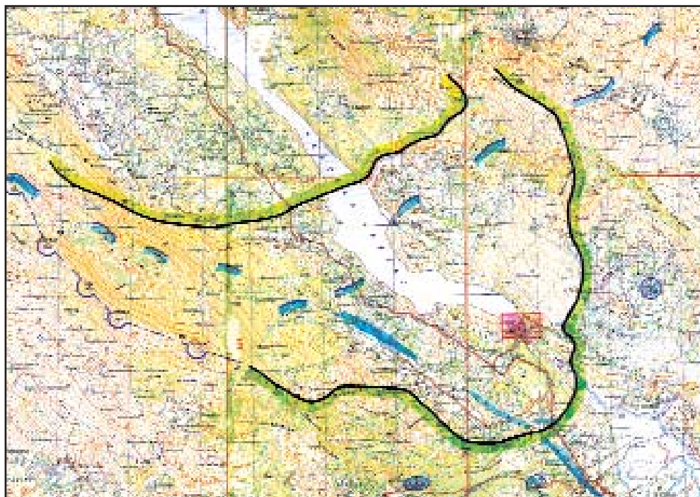
Slika 4: Vojno-redarstvena operacija "Peruća"

stalne vojne i logističke pomoći SRJ. 66 Nadzor granica RH, zaustavljanje dolaska pojačanja iz Bosne i Hercegovine te SRJ, razdvajanje mandata UNPROFOR-a na snage koje će djelovati u Hrvatskoj, Bosni i Hercegovini i Makedoniji 67 bilo je od životne važnosti za RH. Potpisivanje Erdutskog sporazuma 68 i njegova implementacija, 69 živa aktivnost međunarodnih posrednika za bivšu Jugoslaviju (Vance, Owen, Stoltenberg), 70 niz sastanaka u Ženevi, Beču, Londonu, New Yorku, Tuđmanov mirovni prijedlog koji je 22. rujna 1993. iznio u Ujedinjenim narodima 71 te izglasavanje Rezolucije 871. (1993.) 72 znaci su te žive političke i diplomatske aktivnosti što ju je vodila Hrvatska s pobunjenim Srbima, međunarodnim posrednicima, organizacijama i svjetskim silama godine 1993. Te je godine u rezolucijama UN-a konačno i neopozivo potvrđena hrvatska suverenost na cijelom području, ostvareno je nekoliko ograničenih, ali vrijednih vojnih pobjeda koje su pokazale rast i sposobnost oružane sile da u kombinaciji s političkim sredstvima ostvari hrvatske državne ciljeve. RH je pokazala odlučnost da će ustrajati u obrani suverenih i demokratskih načela koje su srpski pobunjenici i SRJ (Srbija/Crna Gora) doveli u pitanje.