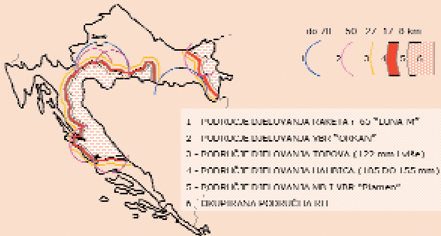
Slika 9: Područja RH pod izravnom ugrozom topništva "SVK" prema Strategiji realne prijetnje