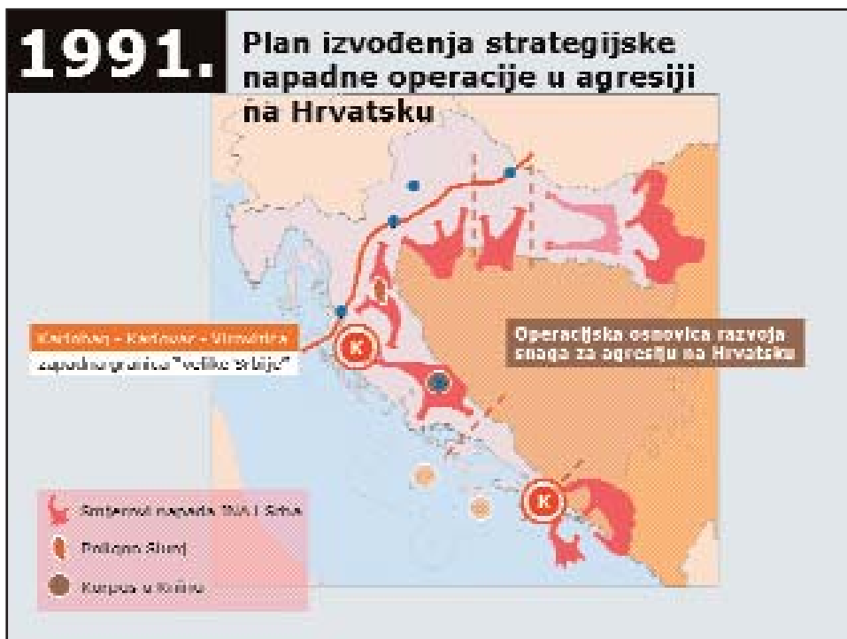
Slika 8: Plan strategijske napadne operacije u agresiji na Hrvatsku (izvor: admiral Davor Domazet-Lošo, "Hrvatska i veliko ratište")