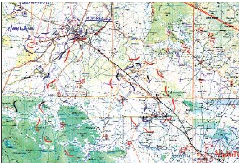
Slika 11: Gospić 1991. - vojna situacija u jesen 1991.

zadatak da dana 09. 09. 1993. godine izvrši nasilno izviđanje u rejonu Mokra pećina, kota 665, Velika kosa i izbijje na liniju Kosa - Dujmovača (kota 618) Bukova glava - Jelovac. O tom važnom dokumentu bit će još riječi, ali valja napomenuti da je gotovost za deystvo naznačena za 09. 09. 1993. u 08.00 časova. 125