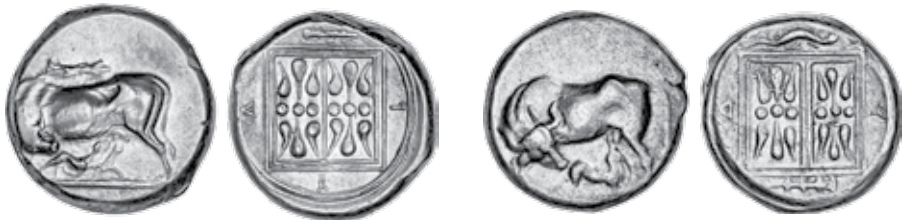
K - 40 (Ø 22 mm, 10,81 g)