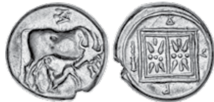
K - 21 (Ø 20 mm, 10,76 g)