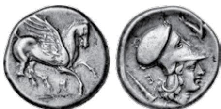
K - 11 (Ø 22 mm, 8,56 g)