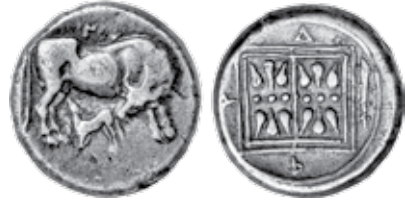
K - 17 (Ø 20 mm, 10,63 g)