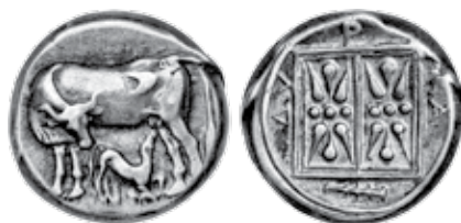
K - 28 (Ø 20 mm, 10,73 g)