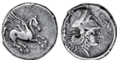
K - 14 (Ø 20 mm, 8,65 g)