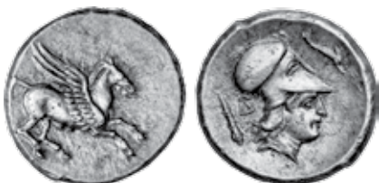
K - 5 (Ø 20 mm, 8,62 g)