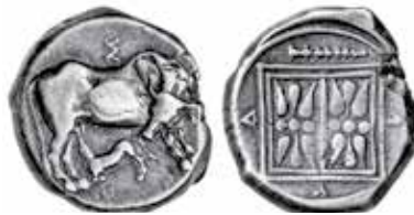
K - 22 (Ø 20 mm, 10,9 g)