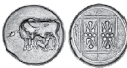
K - 39 (Ø 21 mm, 10,62 g)