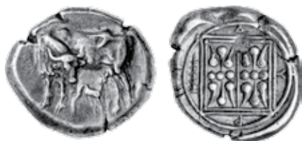
K - 23 (Ø 20 mm, 10,31 g)

* Stater broj 35. u mojoj zbirci teži 9,33 g. Ispod opisane prosječne težine nalazimo stater u SNG Copenhagen, br. 423, težine 7,49 g, a u zbirci Osječkog muzeja (Göricke-Lukić), br. 33, težine 8,4 g.