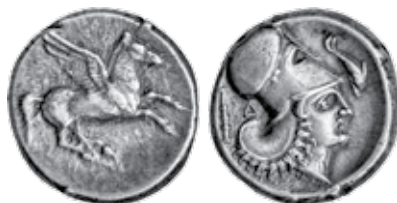
K - 6 (Ø 20 mm, 8,58 g)