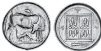
K - 8 (Ø 20 mm, 10,81 g)