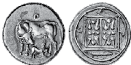
K - 35 (Ø 22 mm, 9,39 g)