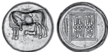
K - 31 (Ø 21 mm, 10,67 g)