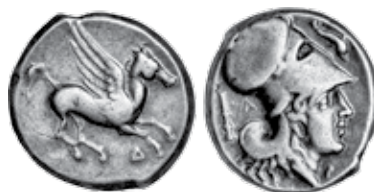
K - 9 (Ø 19 mm, 8,48 g)