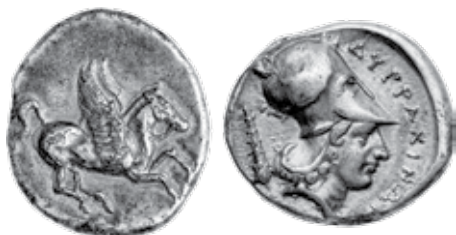
K - 3 (Ø 23,3 mm, 8,3 g)