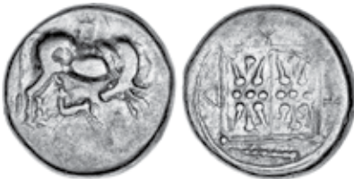
K - 20 (Ø 20 mm, 10,75 g)