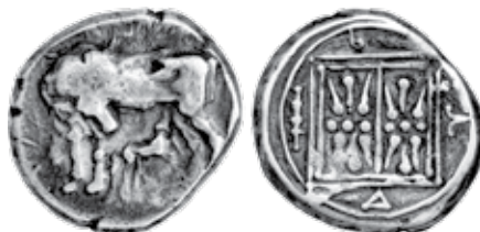
K - 34 (Ø 21 mm, 10,6 g)