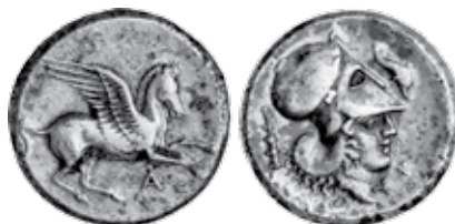
K - 18 (Ø 20 mm, 8,56 g)