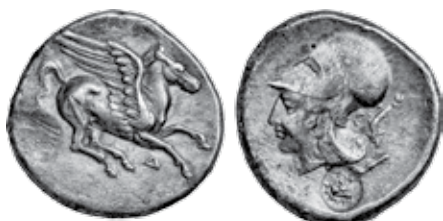
K - 7 (Ø 22 mm, 8,23 g)