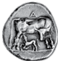
K - 7 (Ø 20 mm, 10,93 g)

M – Maier; K – Kovač; A – Albanien, Schätze aus der Land Shipetoren, Mainz; L – Locket 1634; C – Calciati.