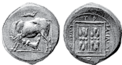
A - 5 (Ø 21 mm)