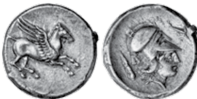
K - 5 (Ø 20 mm, 8,71 g)