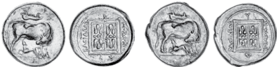
K - 1 (Ø 22 mm, 10,21 g)

* Stater pod brojem 7. opisan je među staterima s legendom grada broj 21., iako ih neki autori ubrajaju u stater Monunija, a opisani simbol navode kao monogram Monunija.