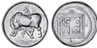
K - 43 (Ø 20 mm, 11,3 g)