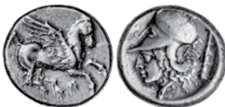
K - 13 (Ø 22 mm, 8,88 g)