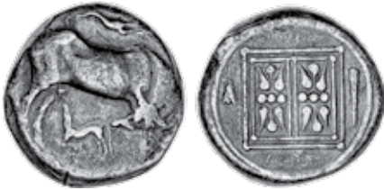
K - 10 (Ø 20,1 mm, 10,03 g)