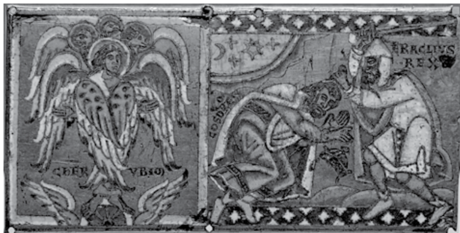
Sl. 5. Heraklije odsijeca glavu Hozroju II. Pločica s križa, Meuse Valley (1160-1170). Champlévé pocaklina na pozlaćenu bakru. Paris, Musée du Louvre, nv. MRR 245.

Priču o carevima Hozroju II. i Herakliju, hozojevom dvorcu - hramu i Heraklijevu povratu Križa, iznose mnogi pisci od ranog do kasnog srednjeg vijeka. Ona je opće poznata u srednjovjekovnoj Europi. Među najvažnije od tih pisaca pripada Hrabanus Maurus (oko 780.-856.), benediktinac i nadbiskup Mainza. On je enciklopedist koji je utjecao na obnovu znanja u Europi. Jedno od njegovih najpopularnijih djela jest De laudibus sanctae crucis . U njemu govori o simbolici raznih oblika križeva i standardno je djelo za sve kršćane koji se bave tom temom. Povrat Križa slavio se 14. rujna u Istočnom Rimskom Carstvu još od 7. st. kao Dan Svetoga Križa. Taj blagdan postaje popularan u 8. st. i na zapadu zahvaljujući homiliji Reversio sanctae atque gloriosissimae crucis Domini nostri Jesu Christi , koja je pripisivana Hrabanusu Maurusu. Iako danas neki autori sumnjaju u njegovo autorstvo, ono je bilo u srednjem vijeku jako popularno.