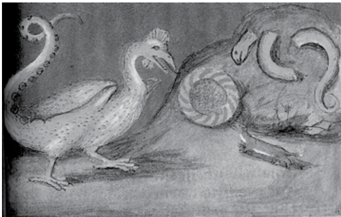
Sl. 6. Aurora consurgens , rano 16. st. (Roob, 1997: 369). Borba lasice i baziliska. U pozadini se vidi rasječena zmija i krug. Ideja je prenesena iz egipatske mitologije.

Ta veza apokaliptičnoga boja i puta prema spasenju, koje simbolizira kuna, razumljiva je kroz alkemijsku tradiciju simbolike lasice, preuzetu iz starog Egipta. Lasica u alkemijskim ilustracijama i kasnoantičkoj tradiciji simbolike raznih bestijara ima svojstvo da može oživjeti svoju mrtvu djecu. Zato je prikladno da to vidimo kod Isusa na križu jer je time naviješteno njegovo uskrsenje. Ona se isto tako jedina može sukobiti s kraljem zmije Basiliskom. Među alkemijskim ilustracijama nalazi se i jedna ilustracija u kojoj lasica siječe zmiju kao što nakon posljednjeg apokaliptičkog boja egipatska boginja Mafdet siječe zmiju Apopi. Zatim je postavlja u krug da bi osigurala buduće ponovno savršeno cikličko kretanje svemira.