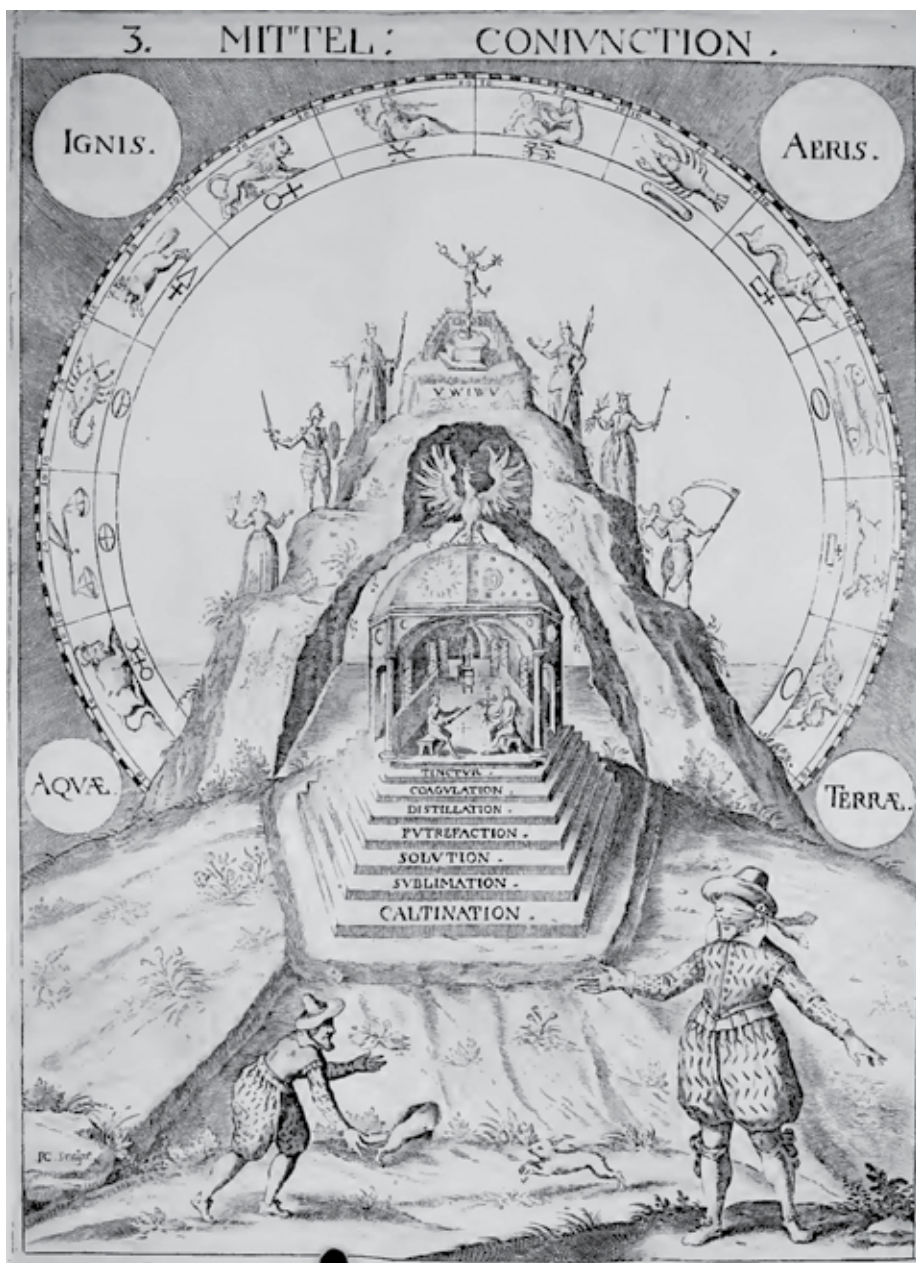
Sl. 3. Stephan Michelspacher's Cabala Spiegel der Kunst und Natur , in Alchymia P 40. Na dnu je lovac koji vreticu/feretku - ictis gura u zeđu jazbinu.