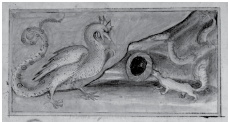
Sl. 7. Zürich, Zentralbibliothek, Ms. Rh. 172: Aurora consurgens U manuskriptu iz Züricha umjesto lasice vidljiva je kuna jer su simbolički zamjenjive.