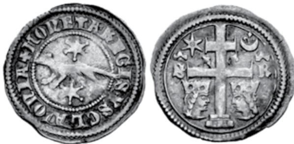
Slika 1. Slavonski banovac

Prikaz okrunjenih glava između kojih se nalazi križ odgovara standardnim prikazima vladara. Takav prikaz nalazi se na kasnorimskom kršćanskom i kasnije na bizantskom i srednjovjekovnom novcu. Na njima su prikazana ili dva ravnopravna vladara, ili vladar i njegov suvladar ili njegov prijestolonasljednik. Takvi prikazi izraz su političke propagande kojom se poziva na jedinstvo carstva odnosno njima se daje politički blagoslov suvladaru. Na novcu se mogu prikazati i kralj i kraljica. Time se naglašavala važnost dinastije, odnosno dinastičkih bračnih veza. Novac je prije imao i određeno magijsko - religijsko značenje. Prikazom neke osobe na novcu ta se osoba na neki način čini posvećenom osobom. I Kristova izreka caru carevo, Bogu božje, upravo se i odnosi na prikaz na novcu. Tom se izrekom naglašavala obveza poslušna prema vlasti, bar su je tako tumačili oni koji su bili na vlasti.