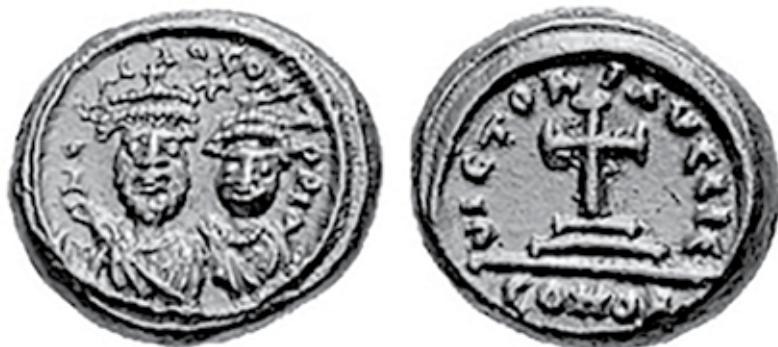
Sl. 2. Okrunjene glave, en face, cara Heraklija i njegova sina Heraklija Konstantina (solid 625./6. - 625./7.). Između njih nazire se križić. Takav je križ različitih veličina na drugim tipovima novca iz vremena Heraklija i kasnije njegove dinastije.

Niti jedno od tumačenja te dvije glave: kralj - mlađi kralj; kralj - kraljica, ne moraju se međusobno isključivati. S obzirom na to da su se banovci kovali više od sto godina (barem od polovice XIII. st. do 1384. g.), te su poruke o jedinstvu unutar dinastije svakako imale važno značenje i u nekom su razdoblju mogle biti i tako shvaćane. U tome je svakako imalo ulogu i to što je često Slavonijom i Hrvatskom vladao herceg prijestolonasljednik. Međutim ne postoji neka svima jasno uočljiva razlika između tih dviju okrunjenih glava. One više-manje izgledaju jednako. Da se željela izraziti neka razlika tipa: kralj - mlađi kralj, kralj - kraljica, to bi se i učinilo. Osim toga herceg i nije uvijek bio mlađi kralj, nego je bio vojvoda (dux), a novac su kovali i banovi u ime kralja. Moguće je da su te dvije okrunjene glave zapravo predstavljale dva kraljevstva koja su ujedinjena simboličkim značenjem križa između njih.