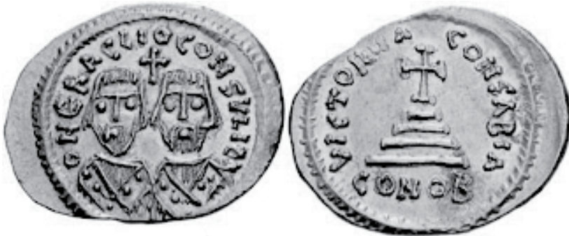
Sl. 4. Zlatni solid Heraklija i njegova oca, isto Heraklija, u odori konzula, kovan tijekom bune protiv Foke. Na aversu Pravi Križ.

Hozroje je napao i sam Carigrad. Imao je kao saveznike Avare i Slavene. Pomoć je Carigradu stigla iz provincije Kartage (današnji Tunis). Namjesnikov sin postaje car Heraklije i nizom genijalnih vojnih i diplomatskih poteza razbija iransku vojsku i njihove saveznike. Ti potezi obuhvaćali su i amfibijske napade, dolazak Irancima iza leđa s pomoću prekokavaskih saveznika. Heraklije je uspio srušiti Hozrojev dvorac i vratiti Pravi Križ u Carigrad.