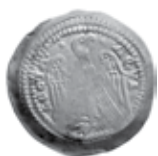
Slika 1. Avers i revers