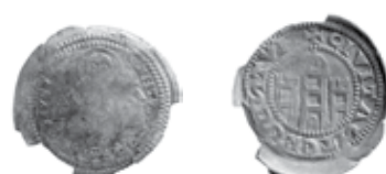
Slika 14. Avers i revers