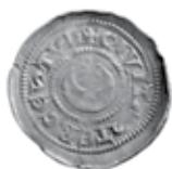
Slika 5. Avers i revers