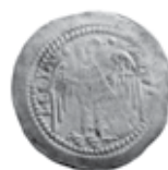
Slika 2. Avers i revers