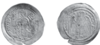
Slika 7. Avers i revers