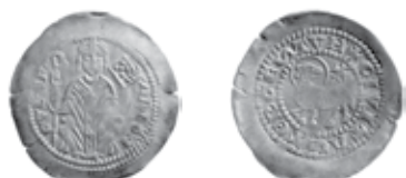
Slika 19. Avers i revers