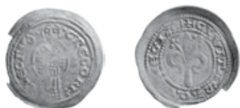
Slika 3. Avers i revers