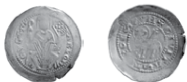
Slika 17. Avers i revers