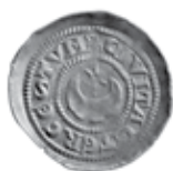
Slika 7. Avers i revers