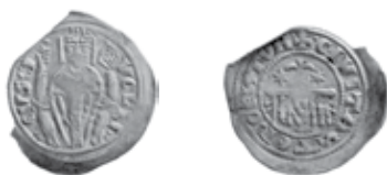
Slika 12. Avers i revers