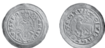
Slika 16. Avers i revers