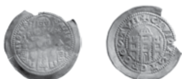
Slika 13. Avers i revers