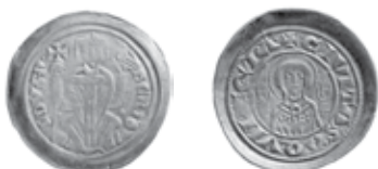
Slika 1. Avers i revers