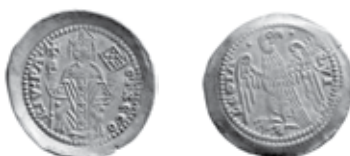
Slika 6. Avers i revers