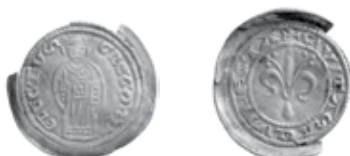
Slika 2. Avers i revers