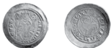
Slika 15. Avers i revers