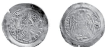
Slika 5. Avers i revers