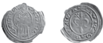
Slika 4. Avers i revers