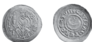
Slika 20. Avers i revers