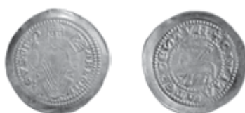
Slika 18. Avers i revers