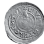
Slika 4. Avers i revers