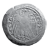
Slika 3. Avers i revers