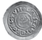
Slika 6. Avers i revers