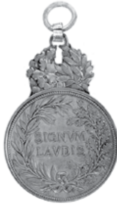
Slika 10. Srebrna vojna medalja za zasluge cara Karla I., revers

Nova Vojna medalja za zasluge na aversu ima poprsje cara Karla, udesno, okruženo vladarskim naslovom: CAROLVS D. G. IMP. AVST. REX BOH. ETC. ET REX APOST. HVNG. (Karlo, milošću Božjom car Austrije, kralj Češke itd. i apostolski kralj Ugarske ). Revers je ostao isti, s natpisom: SIGNVM / LAVDIS ( Znak pohvale, znak priznanja ), okružen vijencem od lovorove (lijevo) i hrastove grančice (desno).