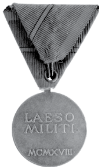
Slika 12. Ranjenička medalja, za prvu ranu, revers.

Ranjeničku medalju dobivali su časnici, dočasnici i vojnici oboljeli i ranjeni na bojištu. Oboljeli od težih bolesti, koje su prouzročile invalidnost, nosili su medalju na trokutastoj vrpici širokoj 39 mm, vojničke sivomaslinaste boje, obrubljenoj dvjema crvenim prugama širokim 5 mm. Ranjenici su medalju nosili na vrpici istih boja, koja je po sredini bila prošarana s jednom, dvije, tri, četiri ili pet pruga širokih 2 mm, ovisno o tome koliko su puta bili ranjeni. Te su uske pruge obrubljene crnim koncem. Vrpцу s pet pruga dobivali su i oni koji su bili ranjeni više od pet puta (slika 13., 14. i 15.).