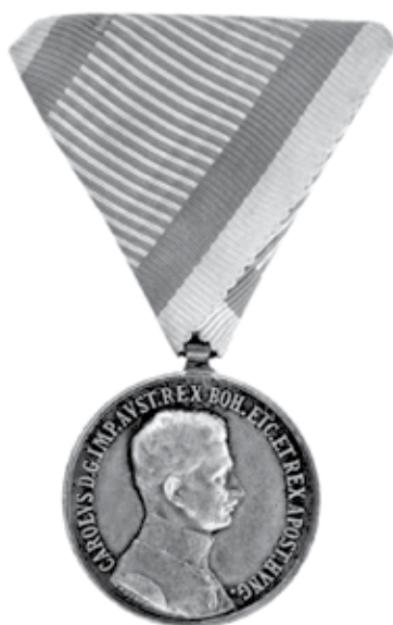
Slika 5. Srebrna medalja za hrabrost II. stupnja s likom cara Karla I., za dočasnike i vojnike, avers.

Dana 4. travnja 1917. godine prof. Heinrich Kautsch (* 28. siječnja 1859., Prag, † 29. rujna 1943., Beč) iskovao je novu Medalju za hrabrost s likom mladog cara Karla I. Ta se medalja kovala u Beču i u Kremnici (danas Slovačka).