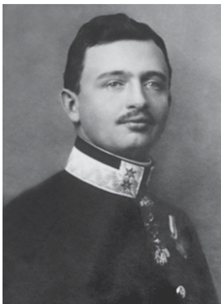
Slika 1. Car Karlo I.

Dvadesetdevetogodišnji car okrunjen je 30. prosinca 1916. Njegova vladavina trajala je praktično do konca Prvoga svjetskog rata, odnosno do raspada Austro-Ugarske Monarhije 31. listopada 1918. (slika 1.). Novi car i njegova lijepa žena, carica Zita, bili su nakon dugogodišnje vladavine Franje Josipa pravo osvježenje na austrougarskom prijestolju. Svuda su ih s oduševljenjem dočekivali, iako je rat već ostavio duboki trag na raspoloženju pučanstva. 2