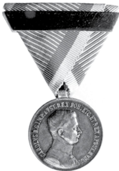
Slika 7. Srebrna medalja cara Karla I., s pločicom za drugu dodjelu.

Prema carskoj naredbi od 15. rujna 1917. Zlatnu i Srebrnu medalju za hrabrost I. stupnja mogli su dobiti i časnici. Da ne bi bilo zabune, 5. listopada 1917. određeno je da časnici dobitnici medalje nose na vrpci 18 mm visoko slovo “K” od pozlaćene kovine (slika 8.).