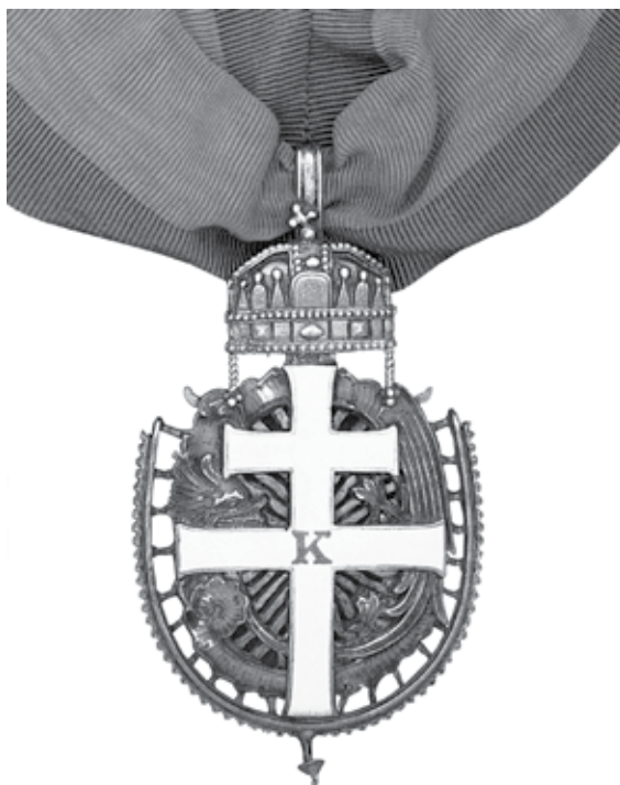
Slika 2. Ugarski viteški orden zlatne ostruge.

Car Franjo Josip I. osnovao je Red Franje Josipa (1849.) i Red Elizabete (1898.). Odlikovanja niže klase – križevi i medalje – također su već bili osnovani u velikom broju i Karlo I. nije imao mnogo mogućnosti za inovacije. On je tek zasjeo na prijestolje i nije imao priliku steći reputaciju svog dugovječnog prethodnika Franje Josipa I. Društvo je pritiskivala ratna zbilja, štedjelo se i odricalo koliko je bilo moguće. No, on je ipak unio neke novosti koje valja zabilježiti.