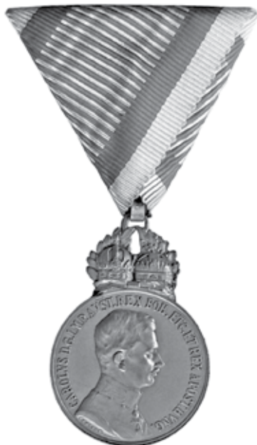
Slika 9. Srebrna vojna medalja za zasluge cara Karla I., avers.

U prvim mjesecima vladavine cara Karla I. nastavilo se dodjeljivanje Vojnih medalja za zasluge s likom Franje Josipa I. Dana 28. travnja 1917. car Karlo I. odredio je otkov novih Vojnih medalja za zasluge svih stupnjeva (slika 9. i 10.), ali uvjeti za njihovu dodjelu nisu promijenjeni.