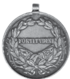
Slika 6. Srebrna medalja za hrabrost s likom cara Karla I., revers.

Na aversu Medalje za hrabrost prikazano je carevo poprsje u maršalskoj uniformi, udesno (sl. 5. i 6.). Uokolo je natpis: CAROLVS D. G. IMP. AVST. REX BOH. ETC. ET REX APOST. HVNG. ( Karlo, milošću Božjom car Austrije, kralj Češke itd. i apostolski kralj Ugarske ). Tada je revers Medalje za hrabrost prvi put izmijenio izgled; dotadašnji natpis na njemačkom jeziku (DER TAPFERKEIT), zamijenjen je natpisom na latinskom jeziku: FORTITUDINI ( Za hrabrost ).