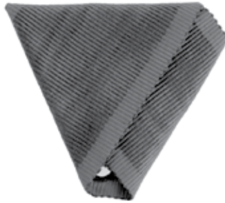
Slika 13. Vrpca za Ranjeničku medalju, za oboljele.