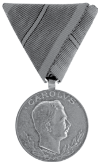
Slika 11. Ranjenička medalja, za prvu ranu, avers.

Tom je rukom pisanom Najvišom naredbom od 12. kolovoza 1917. (koju smo donijeli u slobodnom prijevodu) car Karlo I. inicirao utemeljenje odlikovanja, namijenjena vojnicima carske i kraljevske vojske ranjenima u ratu. Stoga se datum carskoga pisma ne može računati kao datum osnutka Ranjeničke medalje. Datum osnutka jest 22. lipnja 1918., kad je donijet statut Ranjeničke medalje i regulirana njezina dodjela (slika 11. i 12.).