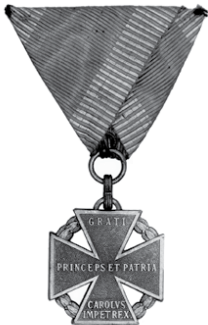
Slika 3. Karlov četni križ, avers.

i signalnih jedinica, čak i zrakoplovcima, ali oni u posebnim okolnostima: ako su obavili najmanje deset borbenih letova protiv neprijatelja. Križ su mogli dobiti i pripadnici ratne mornarice, ukratko svi u oružanim snagama, čak i oni koje je neprijatelj ranio, iako nisu ispunjavali navedene uvjete.