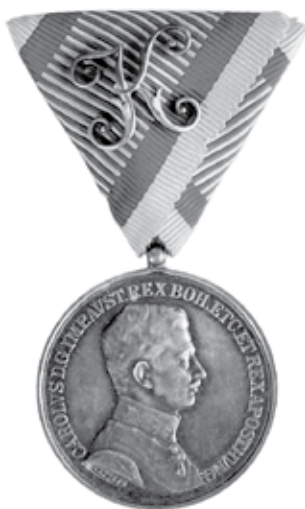
Slika 8. Srebrna medalja za hrabrost I. stupnja, cara Karla I., za časnike.