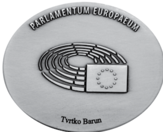
Slika reversa medalje patera Tvrtka Baruna