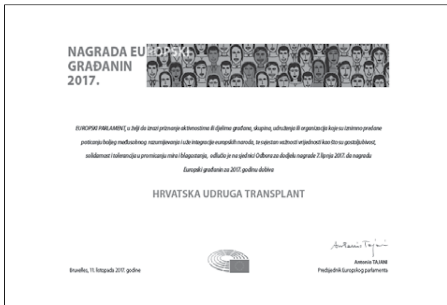
Slika diplome Hrvatske udruge Transplant

Magistar duhovnosti i voditelj Isusovačke službe za izbjeglice u jugoistočnoj Europi sa sjedištem u Zagrebu, koja djeluje od 1993. godine. Služba djeluje u 50 zemalja svijeta te tako pomaže gotovo milijun izbjeglica i drugih prisilno raseljenih osoba.