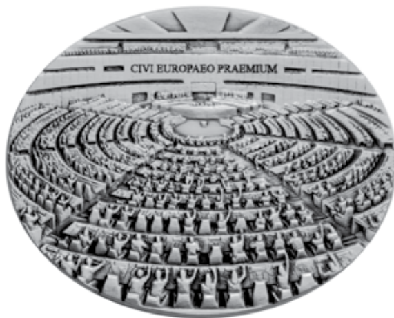
Slika aversa medalje

Do 2014. godine na reversu medalje bio je logo EU na vodoravno položenom transparentu s drškom i dva stilizirana rukohvata. Ispod loga tekst je u dva reda: PARLAMENTUM / EUROPAE.