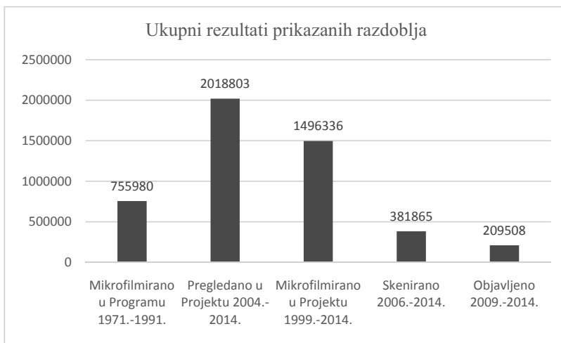
Slika 7. Ukupni rezultati prikazanih razdoblja