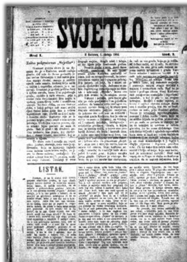
Slika 5. Naslovnica prvog broja