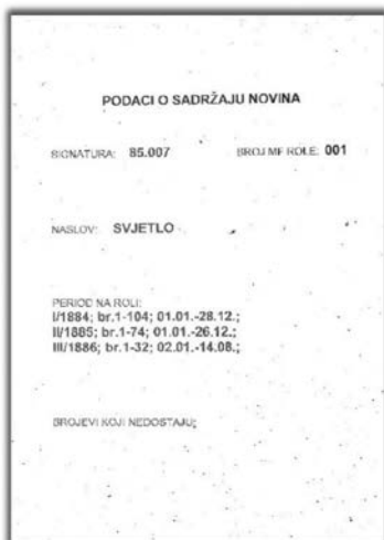
Slika 4. Podaci o sadržaju novina