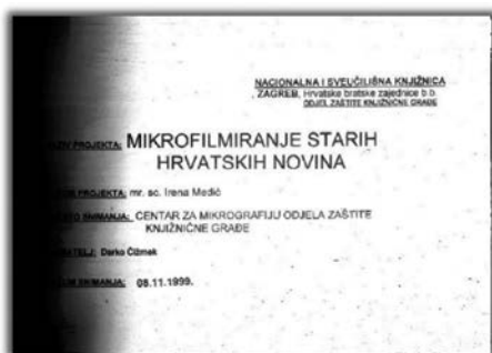
Slika 2. Informativni podaci

povećan broj restauriranih i laminiranih knjiga/publikacija, te da je započelo sustavno mikrofilmiranje novina radi zaštite. Već tijekom sljedeće godine mikrofilmirani naslovi/svesci više se neće davati na korištenje, što je daljnji vid njihove zaštite (istaknuli autori). To će značiti prekretnicu u korištenju novinskog fonda u Knjižnici. 64