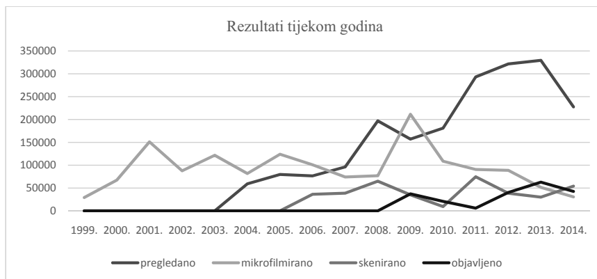
Slika 6. Rezultati tijekom godina

zaštite istodobno koristi i kao posrednik u digitalizaciji. Digitalizacija s mikrofilma počinje odabirom naslova i skeniranjem mikrofilmskih koluta. Skeniranjem se izrađuju digitalne preslike za daljnju obradu u tekstne datoteke 60 , nakon koje se objavljuju na Portalu starih novina i časopisa. 61 U linijskom grafikonu Rezultati tijekom godina (slika 6) prikazani su ti međusobno povezani poslovi pregleda/pripreme, mikrofilmiranja, skeniranja i objavljivanja stranica starih naslova novina.