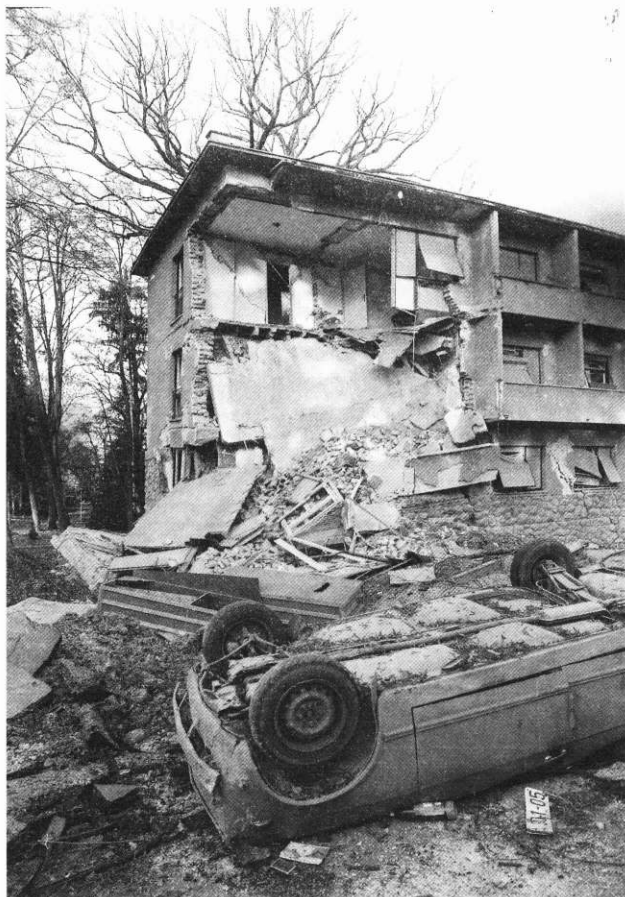
SLIKA 3. Novo krilo Ivanovog doma FIGURE 3. The new wing of the Home of Ivan

Zbog složene političke situacije i ratne ugroženosti, DZ Daruvar napustilo je ukupno 35 zaposlenih, među kojima 5 liječnika i jedan stomatolog. DZ je bez najave napustio i njegov ravnatelj. Neki od tih zdravstvenih djelatnika danas rade za srpske neregularne formacije.