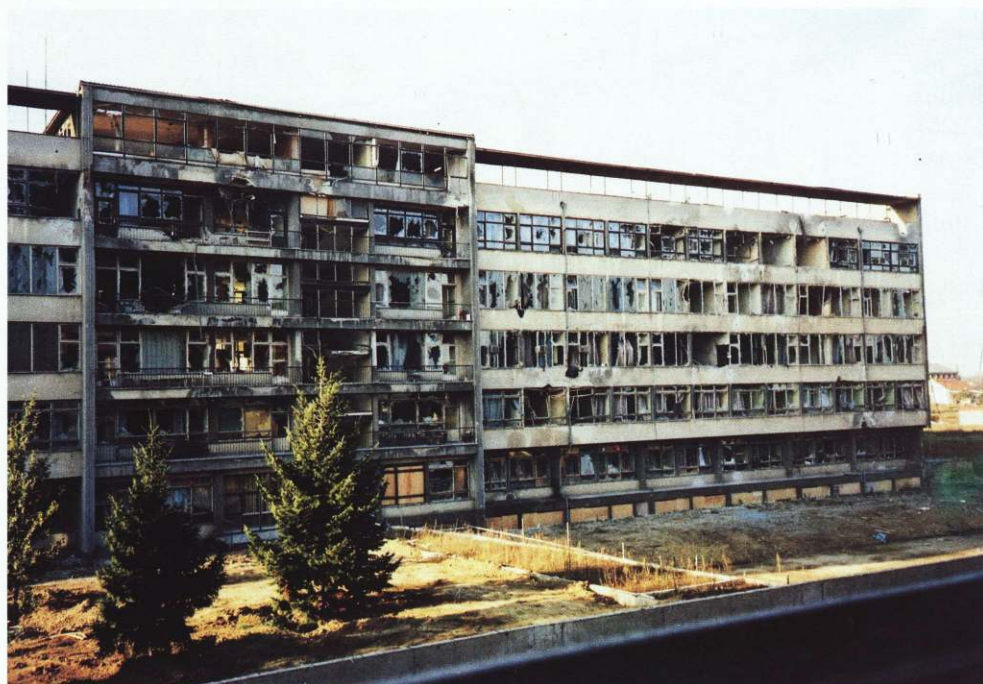
SLIKA 24. Vinkovci 4. studenoga 1991.: Glavna zgrada Bolni- ce, sa zapadne strane