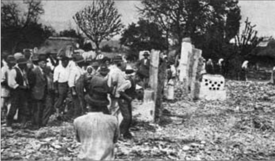
SL. 11. ZGARISTE U SELU KOLAREC FIG. 11 FIRE SITE IN THE VILLAGE KOLAREC

na minimum. Izgrađena su dva tipa kuća, iako su bila planirana tri tipa, u kojima broj soba varira od 1 do 3. Izgrađeno je 6 tipova staja i jedan tip svinjca. Ukupno je izgrađeno 26 novih kuća (15 kuća tipa I i 11 kuća tipa II), a adaptirane su i sve one koje su djelomično izgorjele (njih 15). Pod nadzorom Higijenskoga zavoda izgrađena su ukupno 243 objekta, a podijeljeno je grade za 108 objekata.