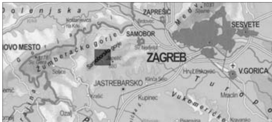
SL. 2. PRIBLIŽNA LOKACIJA SELA BREZOVAC ŽUMBERACKI FIG. 2 VILLAGE BREZOVAC ŽUMBERACKI, LOCATION

U cilju unapređivanja socijalnih, higijenskih i zdravstvenih prilika u Hrvatskoj osnovana je Škola narodnog zdravlja (od 1926. do 1960. godine). Njezino Tehničko odjeljenje izvodi prve konkretne planski osmišljene akcije poboljšanja uvjeta života na selu. Od 1928. do