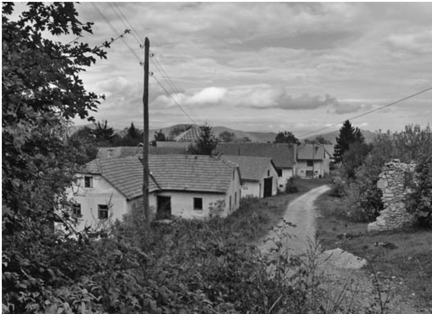
SL. 1. POGLED NA SELO BREZOVAC ŽUMBERAČKI FIG. 1 VIEW OF THE VILLAGE BREZOVAC ŽUMBERAČKI