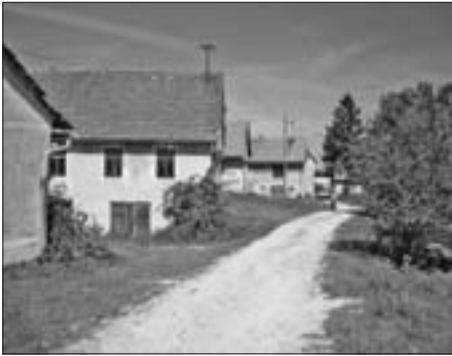
SL. 6. POGLED NA SELO BREZOVAC ŽUMBERAČKI FIG. 6 VIEW OF THE VILLAGE BREZOVAC ŽUMBERAČKI

u požaru je izgorio južni dio sela, odnosno 10 kuća 27 u kojima je živjelo nešto manje od 80 stanovnika. Osim kuća, u južnom dijelu sela izgorjele su sve štale, pojate za mlačenje, 12 komora, 15 svinjaca, jedno tele, jedna svinja, 150 kokoši. 28 Izgorjela je sva hrana (kukuruz, pšenica, mast, krumpiri, zelje), garderoba, sva kola, svi plugovi, bačve za zelje, novac, ormari, škrinje i ostalo. U strašnom plamenu koji se raširio izgorjeli su svi vrtovi koji su se nalazili u blizini kuća, tako da je izgorjela cikla, zelje, konoplja, rani krumpir itd. Kako u selu nije bilo vode, seljaci nisu mogli gasiti požar.