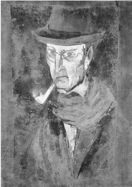
Milovan Stanić, Portret Koste Strajnića , oko 1953.

po važnosti jednakovrijedna velikim i dalekosežnim suvremenim raspravama o metodologiji zaštite spomenika. Danas gotovo sasvim zaboravljeni Brajević, urednik splitskog dnevnika Novo doba , nije poricao vrijednost moderne arhitekture, ali je djelovao s pozicija "arhitektonskog regionalizma", naglašavajući "smislenu modernu varijaciju" rješenja ovjerovljenih u mjesnoj tradiciji. Dijalog dvojice suvremenika bio je po tonu i argumentaciji primjeran, a 1931. u ukupnosti je objavljen u knjižici Misli o čuvanju dalmatinske arhitekture .