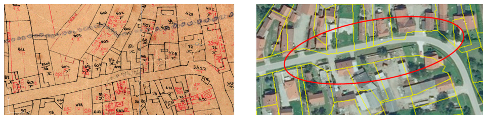
Slika 1. Deformacije nastale nepravilnim spajanjem skeniranih analognih planova.

Osim nehomogenosti grafičkih podataka na analognim katastarskim planovima koje su nastale izvorno prilikom grafičke izmjere i postupka održavanja u analognom obliku, prilikom vektorizacije nastale su i nove deformacije (npr. na mjestima spajanja listova, slika 1, prilikom uklapanja priloga i sl.), a “smještanje” u državni koordinatni sustav (čitaj: transformacija, georijentacija) obavljeno je