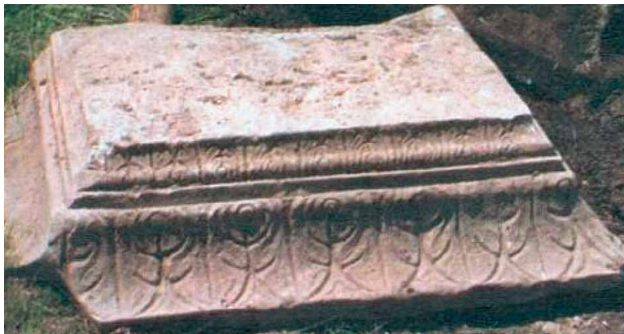
Sl. 6. Epistil (impost) s Karaule – Abb. 6 Epistyl (Impost) aus Karaula

donja manja strana, oko 100 cm gornja šira strana, debljina oko 40 cm (DODIG 2004: 12). Prema ovome proistječe da su pridržavali krov neke ne baš skromne građevine. S obzirom na činjenicu da su na Karauli još u vrijeme istraživanja fra Anđela Nuića i Carla Patscha pronađena i dva četvrtasta stupa, dimenzija sličnih donjim stranama ovih objekata, pretpostavka je da su bili sastavnim dijelom istog objekta. Nije isključeno da je u pitanju bio i hram u kojem su štovani Dijana i Armat (PAŠKVALIN – MILETIĆ 1988: 268; DODIG 2004: 12), čiji su žrtvenici pronađeni na istom lokalitetu. Patsch je pretpostavljao, a s njim se slagao i Esad Pašalić (PAŠALIĆ 1960: 36, 37), da je na Karauli bilo rimsko groblje te neki veći hram u kojem su štovani Dijana, Liber i Armat (PATSCHE 1897: 236–237; 1904: 202–209).