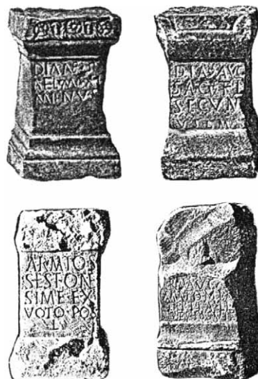
Sl. 4. Žrtvenici Dijane i Armata sa Karaule – Abb. 4 Diana- und Armatus-Opfersteine aus Karaula

DODIG 2004: 12.) te da ovi žrtvenici (šest posvećenih Dijani 4 i dva Armatu 5 ) i potječu upravo s rečenoga lokaliteta. Inače Olimpom duvanjskih Delmata, ako je suditi po broju do sada pronađenih žrtvenika, suvereno je dominirala božica lova Dijana (ŠKEGRO 2000: 97).