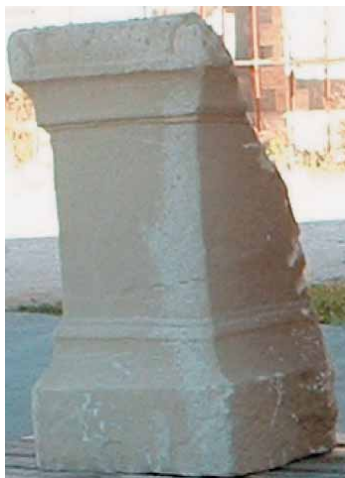
Sl. 3. Žrtvenik bez natpisa sa Karaule – Abb. 3 Opferstein ohne Inscription aus Karaula