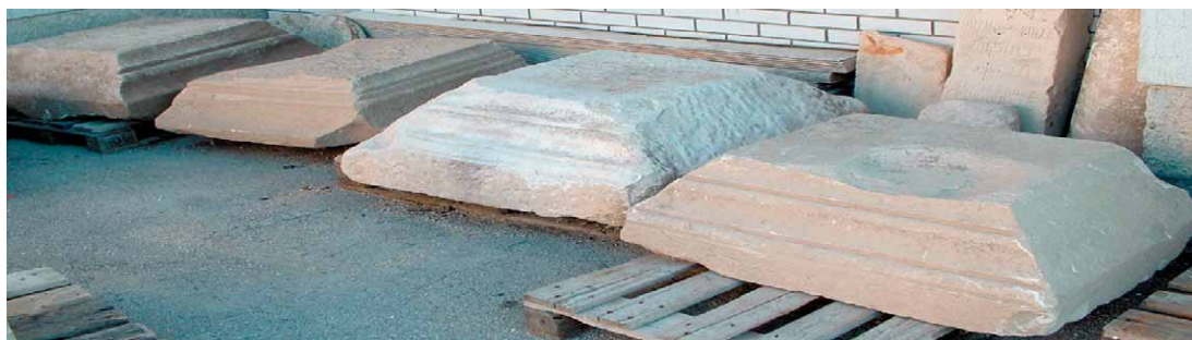
Sl. 5. Epistili (imposti) s Karaule – Abb. 5 Epistyle (Imposte) aus Karaula

S ovog istog lokaliteta potječu i četiri četvrtasta nosača epistila (impost), po svoj prilici dije- lovi neke monumentalne rimske građevine (sl. 5) koji su, vjerojatno, i sami stajali na četverokutnim stupovima. Dva su ukrašena floralnim motivima (sl. 6). Tri su pronađena istovremeno kad i pret- hodni spomenici, a jedan je na istom lokalitetu pronađen još tijekom 1998. g. Dimenzije: 78 x 70 cm