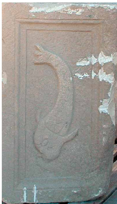
Sl. 1, 2. Kamena baza s natpisom s Karaule – Abb. 1, 2. Steinbasis mit Inschrift aus Karaula

nama profiliranog okvira motiv je lozice s listovima koja raste iz kantarosa. Na vrhovima obiju lozica sjedi po jedna ptica okrenuta jedna prema drugoj. U sredini gornjeg dijela biljnog motiva je peterolisna ruža ( rosa ), iz koje u pravcu ptica izrastaju lozice s listovima, identične onima na bočnim rubovima. Sličan motiv nalazi se i na donjem dijelu profiliranog obruba ovog spomenika. Natpis je popunio malo više od polovice natpisnog polja, što bi moglo značiti da je urezan na već ranije izrađenu bazu. Desna strana baze urešena je također natpisnim poljem, u kojem je umjesto natpisa, u visokom reljefu prikazan dupin okrenut prema dolje (sl. 2). Inače, dupin je čest motiv na rimskim nadgrobnim spomenicima s duvanjskih prostora. Visina slova natpisa iznosi od 5,9 cm (u prvom) do 2,7 cm (u posljednjem retku natpisa). U ligaturama su urezana slova ET u trećem te A i E u drugom i šestom retku natpisa. Umjesto jednoga slova, u trećem retku natpisa u osobnom imenu preminule žene koja se zvala Pajona, urezana su dva slova I ( Paiio ). Znakovi interpunkcije u vidu trokutova oštih rubova razdvajaju slova prvog retka, potom praenomen , nomen i cognomen drugog retka te dva slova I u trećem retku. Natpis je urezan elegantnom rustičnom kapitalom oštih završetaka slova, karakterističnom za rimske natpise Principata. S obzirom na činjenicu da se baza nalazila duboko pod zemljom, natpis se dobro očuvao i razgovjetno se čita: