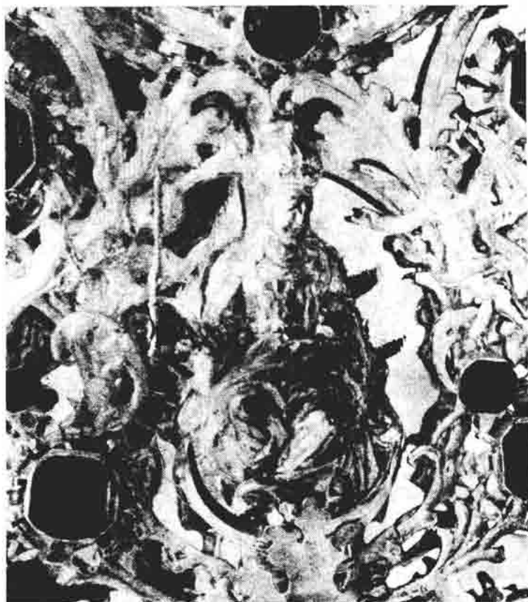
Sl. 141. — Senj, Riznica stolne crkve, pokaznica, detalj.

Ova je monstranca publicirana u monografiji »Senj« 6 slijedećim riječima: »Ova je velika pokaznica za svečane zgode sva od masivna srebra, ali je čitava dobro pozlačena i ukrašena brojnim dragim kamenjem. Na podnožju su slike iz muke Isusove u emajlu. Ovaj vrlo dobri i solidni zlatarski rad ima sve karakteristike zlatarskih radnja za crkvene potrebe u vrijeme baroka polovicom 18. stoljeća. Pokaznica je nabavljena godine 1730. iz legata senjske patricijke Ivke Radić, udovice Miloša Radića, vlastelina senjskog. Ivka Radić umrla je u Senju 21. veljače 1726. godine, a sačuvana je njezina oporuka od 13. veljače iste godine pisana hrvatskim jezikom. Odlomak koji se odnosi na pokaznicu glasi: 'Zatim urdinira i reče, da buduć od svega serca