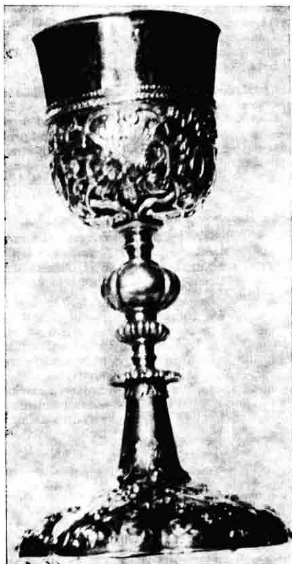
Sl 142. — Osijek, župna crkva Preslavnom imenu Marijinom, Donji grad, kalež, rad Johanna Zeckela iz godine 1715.

Nicht nur der Adel und die Kirche in Österreich, sondern auch das von Österreich politisch, religiös und kulturell stark beeinflusste Kroatien, bestellten im 17.