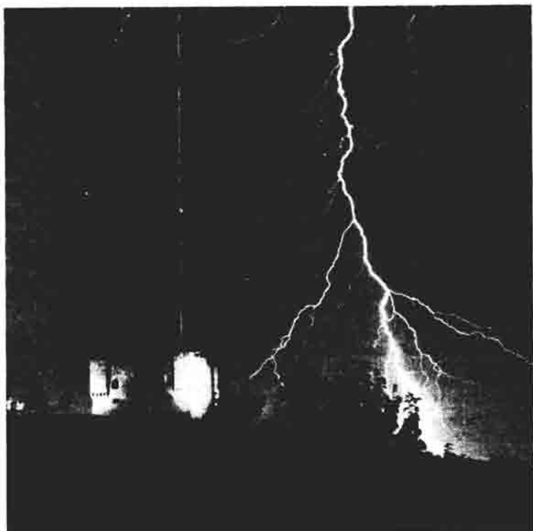
Sl. 143. — Tvrđava Nehaj u noći osvijetljena reflektorima i bljeskom munje (snimio inž. Srećko Božičević, 1965).