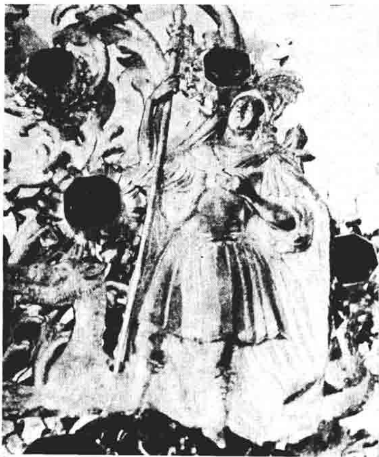
Sl. 140. — Senj, Riznica stolne crkve, pokaznica, detalj Sv. Jurja.

Ova raskošna monstranca obilježena je mjesnim žigom Augsburga iz prve polovice 18. stoljeća (pinija) kao i inicijalima majstora I Z u ovalu, dok