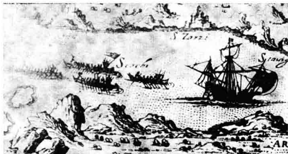
Sl. 144. — Uskoci rastjeruju mletačke galije u Podgorskom kanalu, R. Rosaccio 1598.