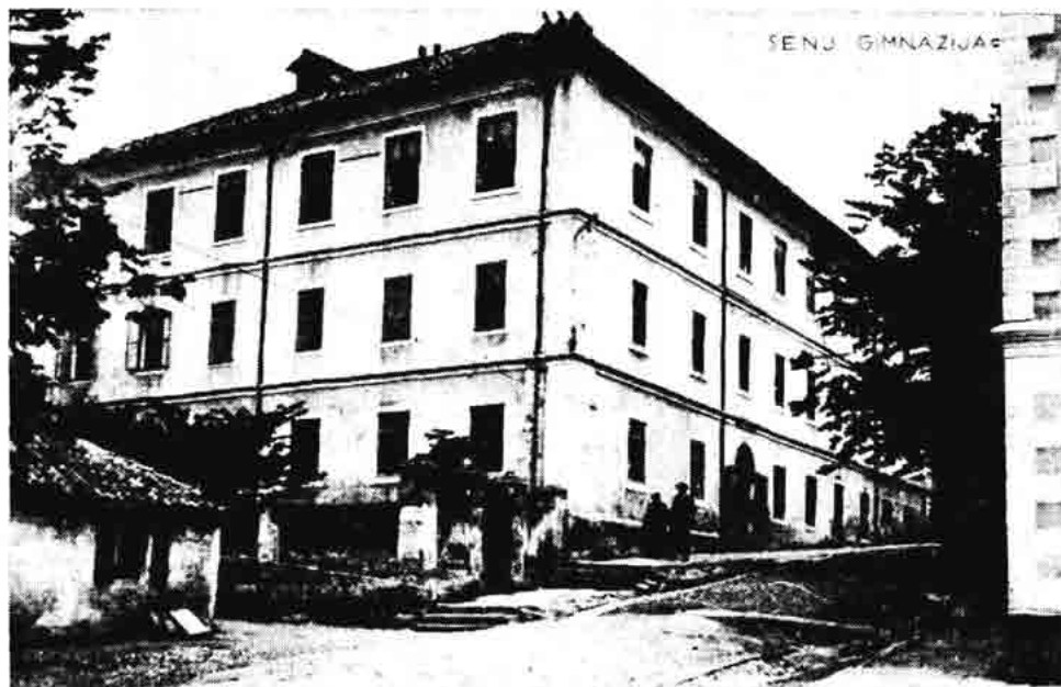
Sl. 151. — Stara zgrada senjske gimnazije, oko 1930.

U Kronici za tu godinu stoji da je Odlukom visokog ratnog ministarstva od 19. rujna 1850. godine (B. 4202) i Naredbom visoke zemaljske vojne komande od 26. rujna iste godine (Q 6971) opunomoćena gimnazijska direkcija da za 12. ispražnjeno mjesto suplenta postavi provizorno viši učitelj