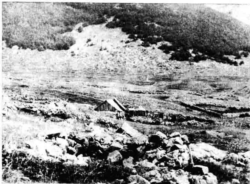
Sl. 155. — Planinsko naselje Mirovo iznad Jablanca. Posljednje sezonske nastambe, stanje 1967.

Jela pripovijeda da su imali nekada pčele, koje su često na konjima nosili gore u planinu, gdje je za njih bilo dovoljno »paše«. Pred kraj ljeta, početkom jeseni, ponovo se narod vraćao svojim kućama. Pčele su se prigonile, a med i vosak cijedio. Vosak koji je ostao dalje se kuhao, sve dok ne bi iscurila »voskocidina«, a ostao čisti vosak. Od njega su se pravile svijeće i to tako da bi se vosak ugrijao, zatim povaljao i u njega stavio komad »bumbaka« (debeli konca), a sve se onda zavaljalo, već prema tome kako je trebala biti debela svijeća.