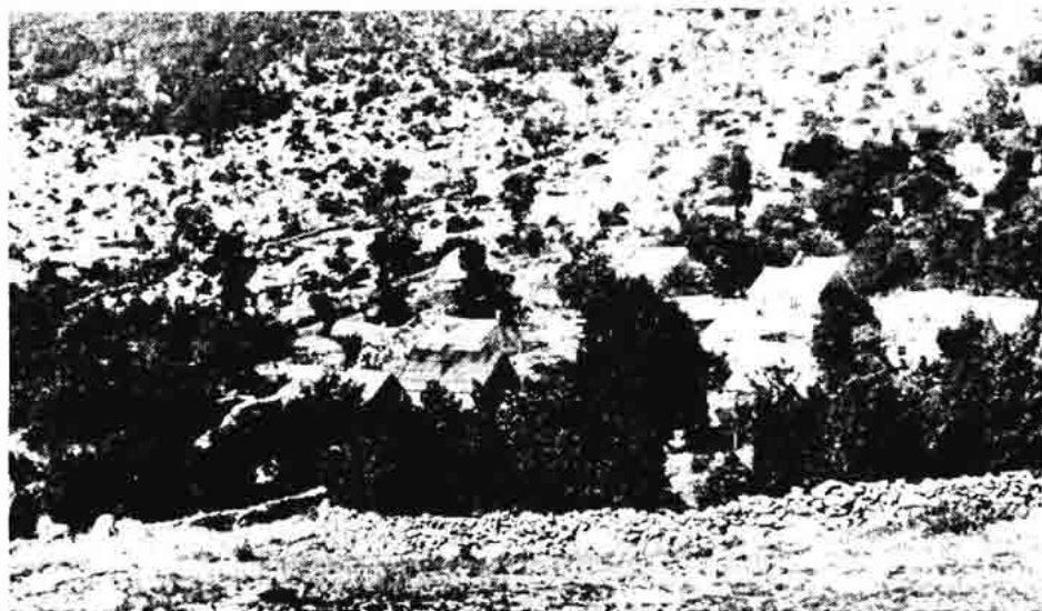
Sl. 158. — Napušteno planinsko naselje Stokić-pod iznad Jablanca, 1967.

Na Uskrs ispekao se ili skuhao ječmeni kruh pod pekom, te se omotao u »tavijol« (ubrus) i stavio u torbu uz meso, jaja i kolače, ako je bilo takve hrane. Po običaju hrana se nosila u crkvu sv. Nikole ili sv. Ivana na blagoslov. Poslije Uskrsa pop je išao od sela do sela i usput blagoslivljao kuće i ukućane. Usput je njegov pratilac zvonio i najavljivao dolazak blagoslova.