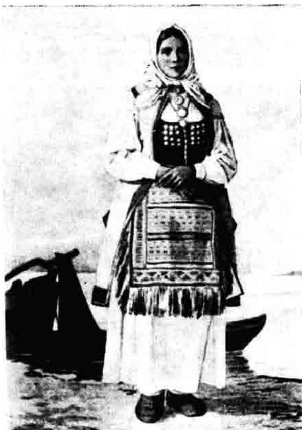
Sl. 154. — Djevojka iz senjske okolice odjevena u narodnu nošnju (iz djela »Das Was verschwindet«, Leipzig 1870).

Prema predaji njezini stari da su doselili u Podgorje iz Krajine, od Pazarišta. Kaže da su prije nas (misli na Bunjevce) u ovome kraju živjeli Grci i Turci. U starije doba da je župa za sela Podić, Kalić, Marince, Vranjak, Bačvice i druga gornja sela bila u Gornjoj Prizni, gdje je od starine crkva sve. Ivana, a uz nju groblje. Navodi da je prije župa bila dolje pri moru u Donjoj Prizni, uz crkvu sv. Ante, uz nju da je bila pučka škola i »financa«.