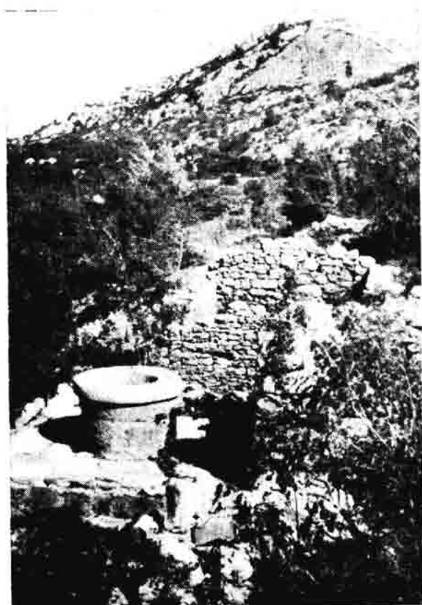
Sl. 161. — Napuštene kuće jednog zaseoka sjeverno od Strogira, sjeverni Velebit 1967.

Bez straha ili nekog srama koji ovlada ljudima na selu kada ih se snima ili riječ zapisuje, mnoge stvari iz njezina života ona nam je ispričala neposredno, pjevala je kada je trebalo, dapače ispravljala sve ono što smo krivo čuli ili zapisali. Pjevala nam je manji broj starih narodnih pjesama kojih se