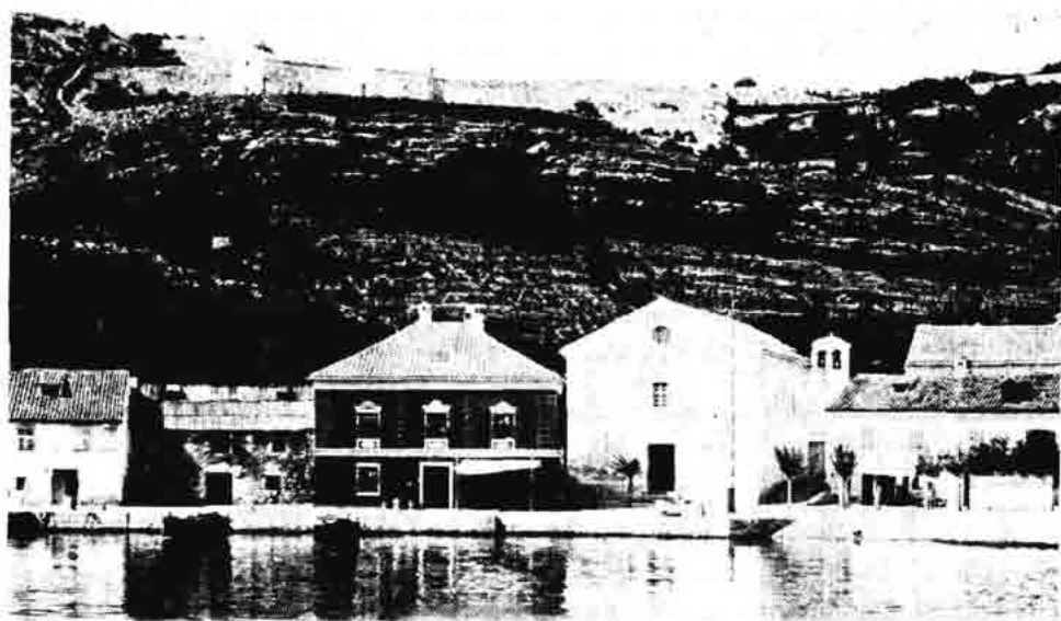
Si. 159. — Mjesto Jablanac. Iznad naselja nalazi se crkva sv. Nikole iz XII st. Uz nju je groblje svih stanovnika crkvene župe Jablanac.

Uz ostalo stara Jela je naglasila da je rodila dvanaestero djece, bez babcice i liječnika. Obično joj je kod poroda pomagala njezina sestra ili neka susjeda. Bio je običaj da žena poslije poroda osam dana leži na miru, a četrdeset dana čuva se od muža.