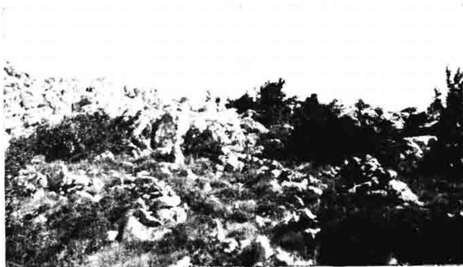
Sl. 157. — Ostaci mirila na počivalištu iznad Živih Bunara, stanje 1967.

Mjerilo se samo domaćim starim mjerama, i to: »mezanama« (drvenim posudama od litre), »pomalićem« (od 2 litre) i »malićem« (od 4 litre). Time se mjerilo žito, brašno i drugo.