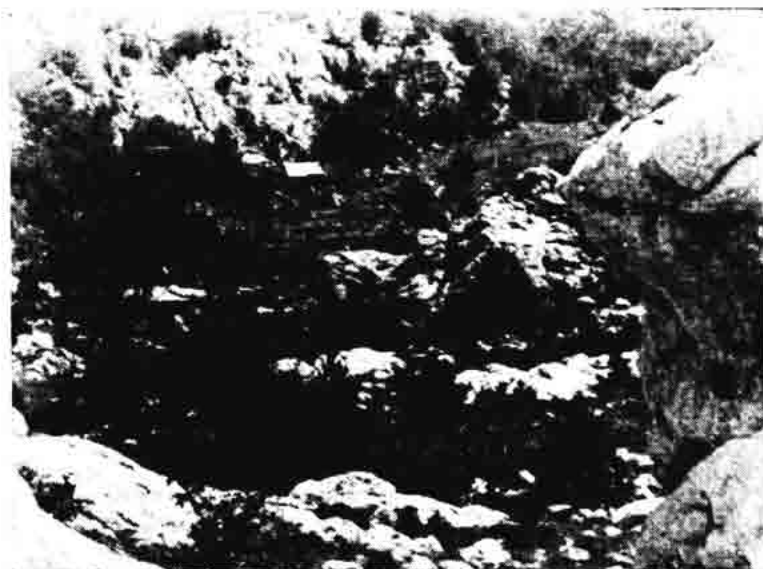
Sl. 160. — Planinski predjel iznad Palježa, sjeverni Velebit 1967.