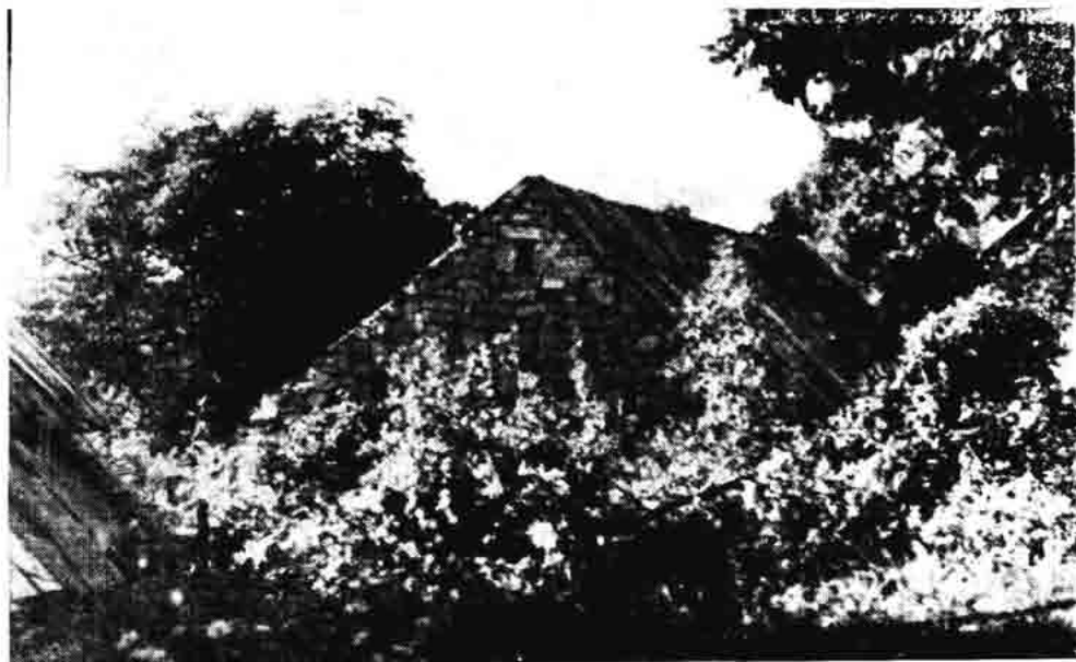
Sl. 162. — Napuštene kuće naselja Bileni iznad Jablanca, 1967.

»Senjani se u lov podigoše, Na njih božje vrime udariše: Snig i bura do sinjega mora. Ledene se toke za jačermu, A jačermu za tanke košulje, A košulje za pleći junačke.