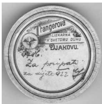
Kutijica za prašak iz Trangerove ljekarne.