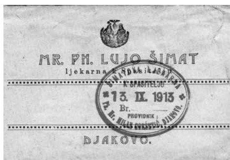
Vrećica za lijek Šimatove ljekarne K Spasitelju, nakon što ju je preuzeo ljekarnik Goršetić

Ljekarnu „K Spasitelju” otvorio je u prosincu 1893. godine ljekarnik Stevan Kathrein 66 (1859.-1922.), koji je prije toga bio zakupnik Trangerove ljekarne. Za razliku od ljekarne „K sv. Duhu”, bila je to ljekarna s tzv. osobnim pravom. Kathrein je u Đakovu od 1884. godine (ili i prije), jer ga tada nalazimo upisanog kao podupirućeg člana Pjevačkog društva „Sklad”. 67 Osim toga, pružao je svakodnevni obrok jednom siromašnom učeniku IV. razreda, koji je bio bez oba roditelja, i to počam od 16. 11. 1884. god. 68 Kathrein odlazi iz Đakova, vjerojatno u Graz, gdje je i umro 1922. godine, a sahranjen je na đakovačkom groblju. 69