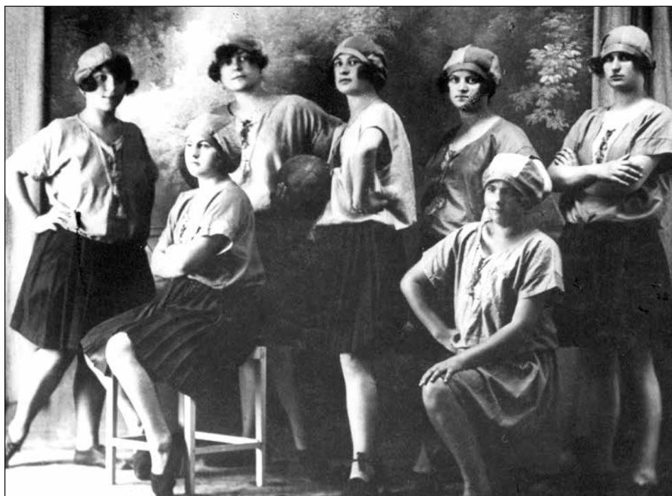
HAZENA EKIPA ĐŠK-a iz 1923. GODINE

Uzvratni susret odigran je u Đakovu i opet je pobijedila ekipa SK Bosanac, ovaj puta s 10:5. (B. CUVAJ: Bosanski Šamac po družini hazene 1922.-1926. postaje razvijeno sportsko mjesto ).