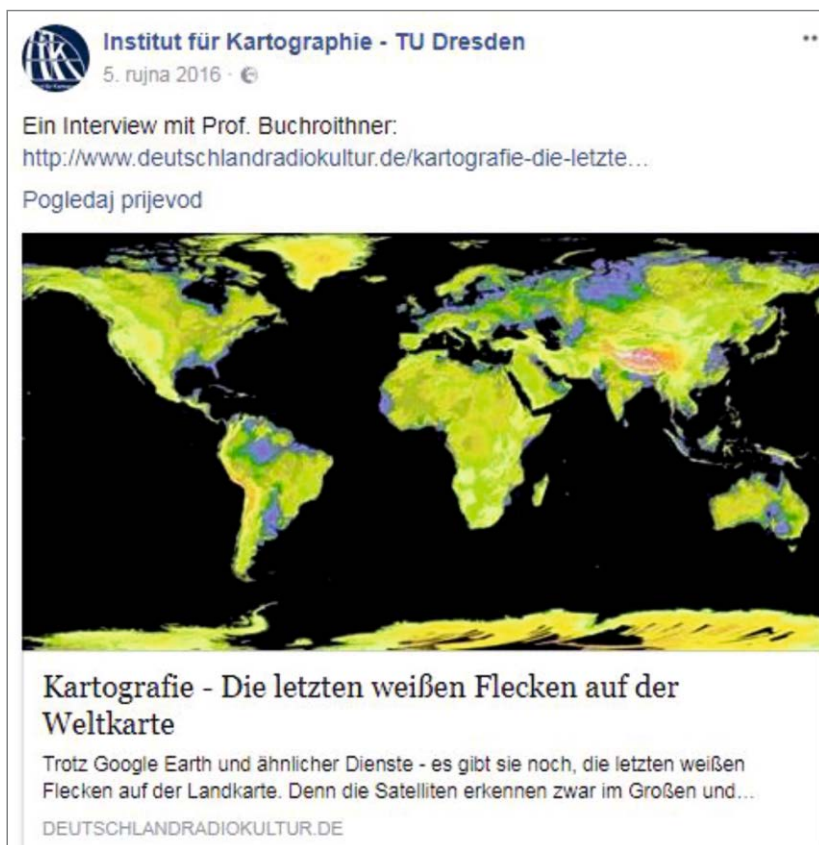
Fig. 5. Information about the last white spots on the world map Slika 5. Informacija o posljednjim bijelim mrljama na karti svijeta