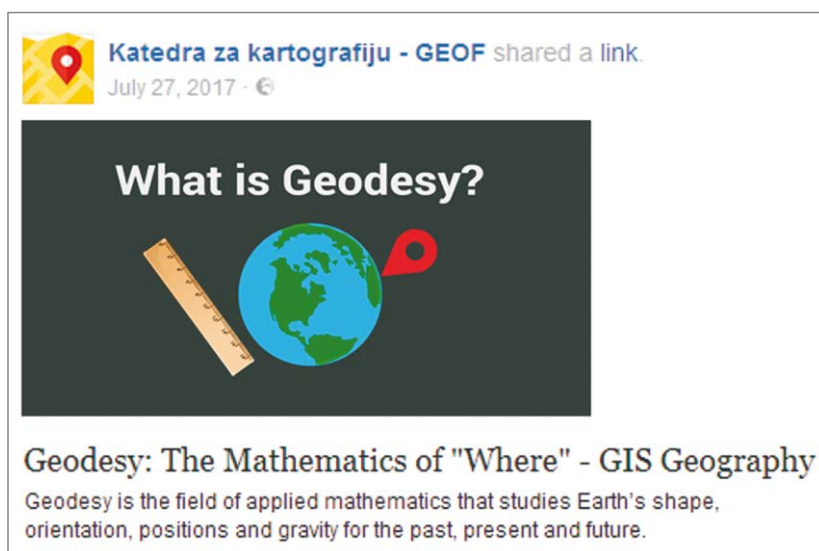
Fig. 6. Post on the profile of the Chair of Cartography Slika 6. Objava na stranicama Katedre za kartografiju

We are going to emphasize two national mapping agencies (NMA) on Facebook. On September 10, 2017, US Geological Survey (USGS) asked its followers (a total of 475 000) to learn the consequences of Hurricane Irma using its Flood Event Viewer (Fig. 3). Ordnance Survey (OS) also used Facebook to inform its followers (a total of 30 487) about its activities (Fig. 4).