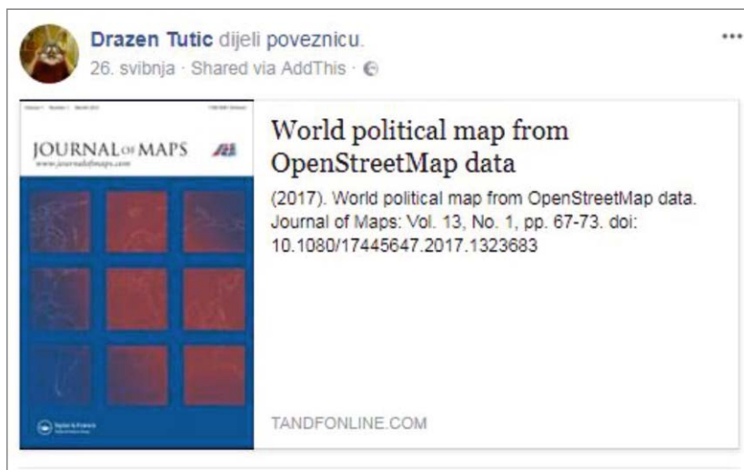
Fig. 8. Information about a paper published in Journal of Maps Slika 8. Informacija o članku objavljenom u Journal of Maps

Od Nacionalnih geodetsko kartografskih agencija ( National Mapping Agency - NMA ) na Facebooku skrećemo pozornost na dvije. US Geological Survey (USGS) na svojim stranicama 10. rujna 2017. poziva građane, svoje pratitelje (ukupno 475 000), da se bolje upoznaju, s posljedicama uragana Irma uz pomoć njihova Flood Event Viewera (sl. 3). I Ordnance Survey (OS) se služi Facebookom da pratitelje (ukupno 30 487) obavijesti o svojim aktivnostima (sl. 4).