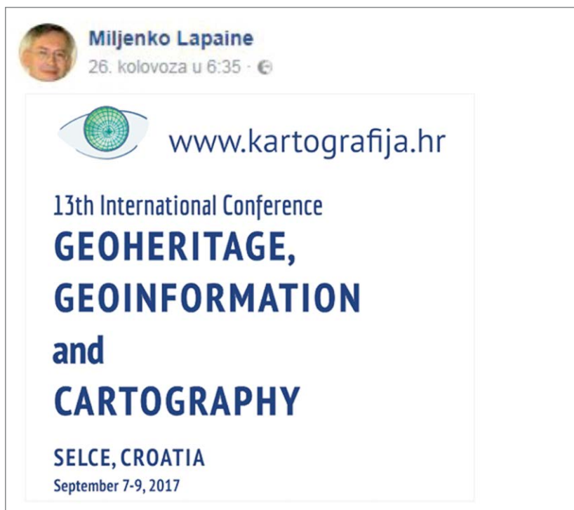
Fig. 7. A post by Miljenko Lapaine Slika 7. Objava Miljenka Lapainea