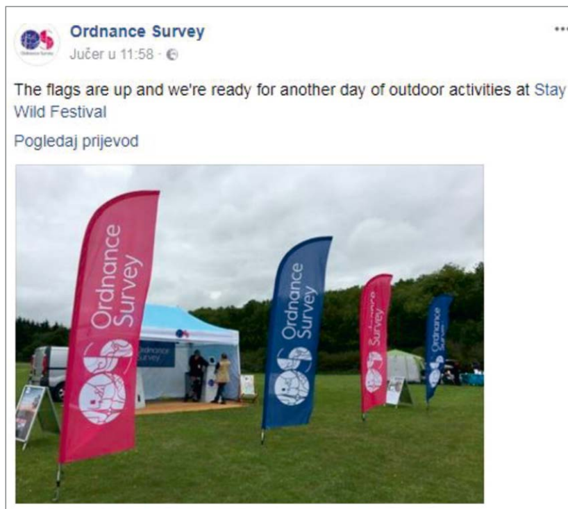
Fig. 4. Ordnance Survey's message on the Stay Wild Festival Slika 4. Obavijest OS-a o Stay Wild Festivalu