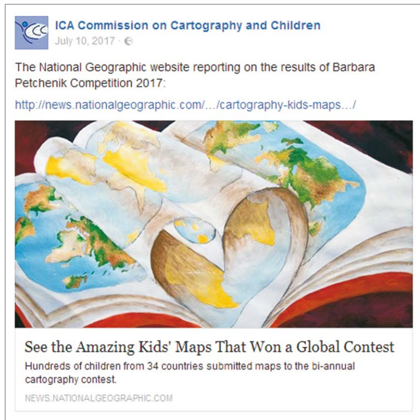
Fig. 1. Results of the 2017 Barbara Petchenik Competition Slika 1. Rezultati natječaja Barbara Petchenik za 2017.

Croatian Cartographic Society (CCS) has had a Facebook profile since 2015. It currently has 298 followers and contains lots of information on CCS activities – exhibitions, conferences, workshops, new books (Fig. 2), etc.