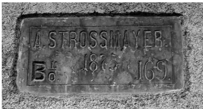
Ploča sa kućnim brojem na kući u Preradovićevoj broj 9.