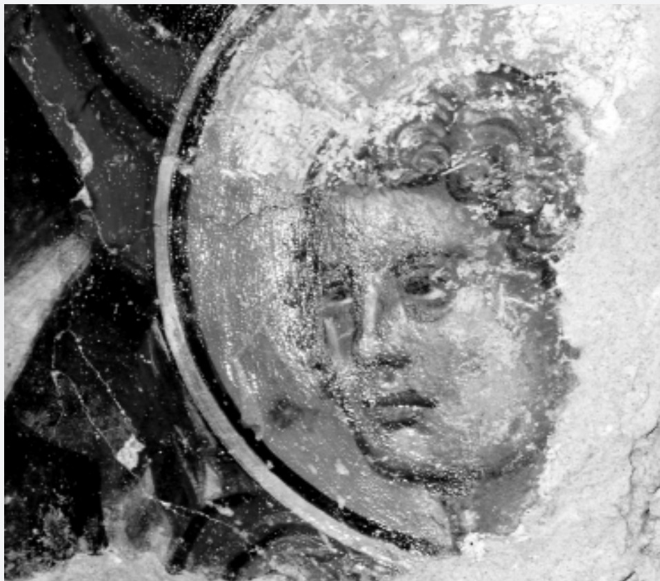
Andeo, detalj freske, 14. st., sakristija Male braće u Dubrovniku

istraživanja zadarske katedrale, točnije otkrića vezana uz promjene prostora i funkcije sakristije s posebnim naglaskom na fazu 14. st. u kojoj je nastao i ikonografski zanimljiv fresko oslik. Stanko Piplović je govorio o sakralnom sklopu Sv. Duha u Splitu koji je u 14. stoljeću doživio temeljitu pregradnju i proširenje, naglasivši pritom važnost fenomena bratovština. Izlaganje Nikše Petrića o arhitekturi grada Hvara u 14. stoljeću predstavilo je bogatstvo romaničke, romaničko-gotičke te ranogotičke morfologije prisutne uglavnom na spomenicima stambene arhitekture. Na svezu urbane i ruralne umjetnosti upozorio je Ante Milošević koji je u svom izlaganju govorio o problematici klesarskih radionica i datacije stećaka na području Dalmatinske zagore. Vladimir Bedenko je na temelju arhivskih i arheoloških istraživanja dvaju najznačajnijih spomenika sakralne