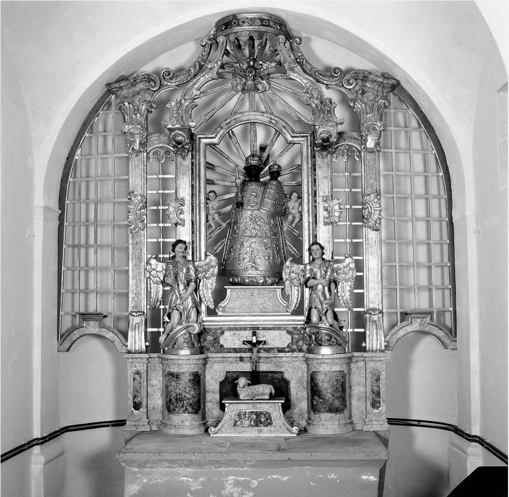
Plešivica, župna crkva Sv. Jurja, oltar Majke Božje Loretske (1757.) nakon restauratorskih radova

vršavanje te mjesto međunarodnih savjetovanja i susreta. Radionice poput ove za svaku su pohvalu jer i teorijski i praktično daju restauratorima i konzervatorima uvid u nastajanje samoga umjetničkog djela te mogućnost boljeg razumijevanja i poznavanja tehnike. Stalno stjecanje novih znanja i vještina te razmjena iskustava o tehnikama, njihovu razvoju i specifičnostima obogaćuju i unapređuju restauratorsko-konzervatorsku struku te osiguravaju kvalitetu rada, pa se može očekivati da će takvi seminari i dalje pratiti i obogaćivati rad naših stručnjaka.