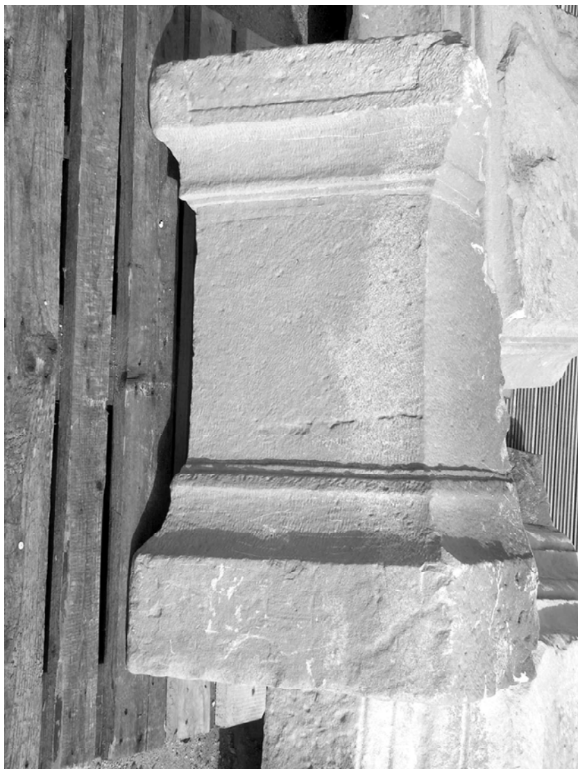
Sl. 4. Žrtvenik s Karaule, Tomislavgrad