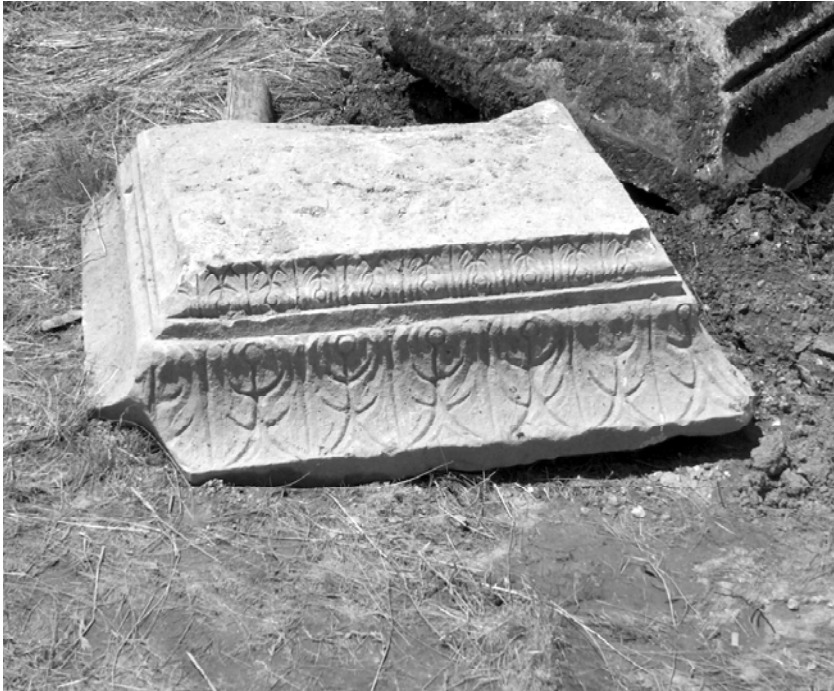
Sl. 3. Kapitel pilastra s Karaule, Tomislavgrad