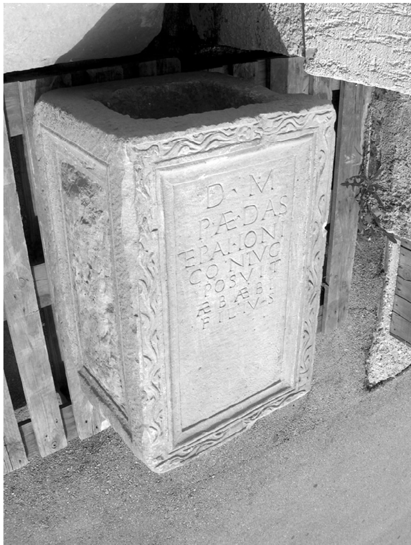
Sl. 1. Rimski nadgrobni spomenik iz Tomislavgrada