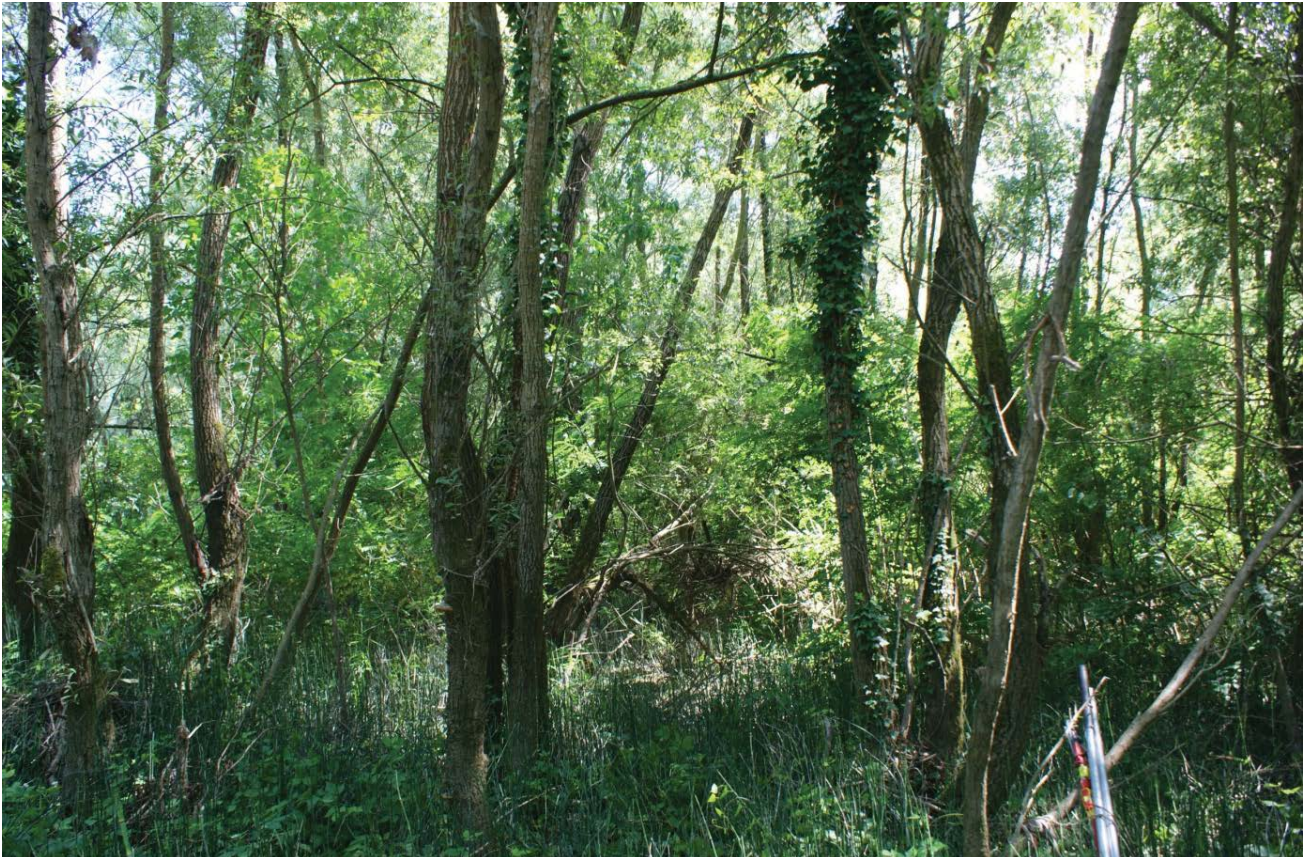
Slika 3. Šuma bijele johe sa zimskom preslicom kod Ormoškoga jezera. U prizemnom sloju dominira Equisetum hyemale . Figure 3. Grey alder-scouring rush forest by Ormoško Lake. The ground layer is dominated by Equisetum hyemale .

vom preko Pažuta, Slatinskih podravskih šuma do Donjega Miholjca, ali ne više kao edifikator u asocijaciji sa zimskom preslicom (Vukelić i dr. 1999; Vrček 2011; Poljak i dr. 2018).