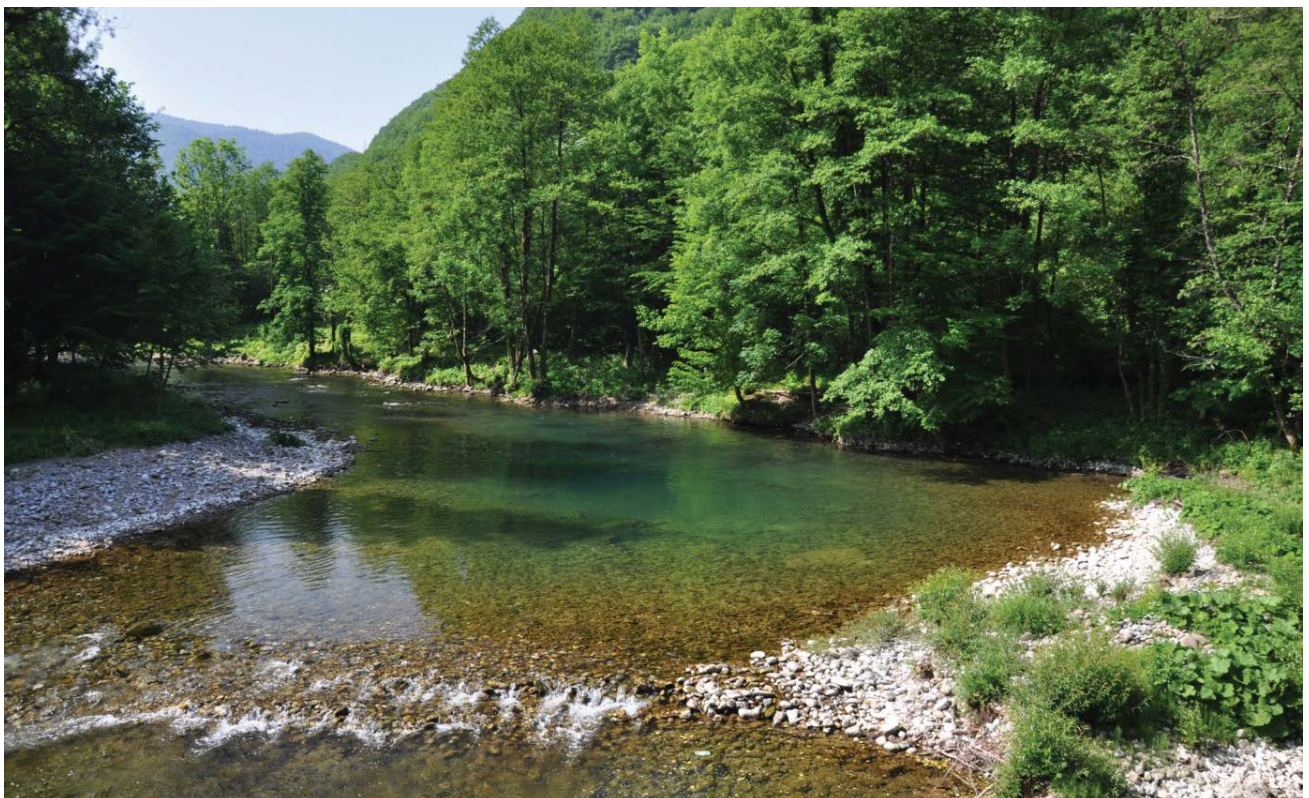
Slika 5. Šumska vegetacija uz Kupu kod Kupara. Figure 5. Forest vegetation along the Kupa river by Kupari.