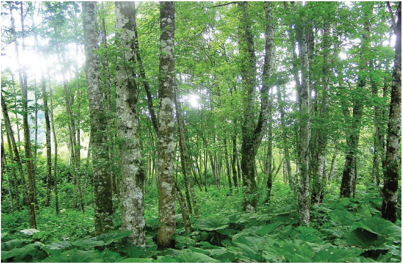
Slika 4. Šuma bijele joha s mrtvom koprivom kod Mele Lešnice u Gorskome kotaru. U prizemnom sloju dominira Petasites hybridus . Figure 4. Grey alder-balm leaved archangel forest by Mala Lešnica in Gorski kotar. The ground layer is dominated by Petasites hybridus .