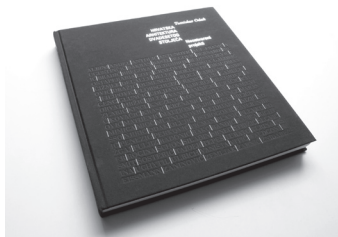
TOMISLAV OĐAK: HRVATSKA ARHITEKTURA 20. STOLJEĆA – NEOSTVARENI PROJEKTI UPI-2M, ZAGREB, 2007.

Povijest arhitektonskih praksi povijest je dviju paralelnih stvarnosti arhitekture. Jedna se odnosi na izgrađenu arhitekturu koja formira fizionomiju izgrađenog okoliša. Ta arhitektura postaje dio svakodnevice, predstavlja okvir za život, gradi urbane identitete i duboko je uvjetovana društvenom stvarnošću. Uz tu materijalnu stvarnost arhitekture postoji i druga stvarnost, stvarnost ideje i koncepta. Upravo je postojanje koncepta preduvjet za razlikovanje arhitekture od pukog građenja, pa je tako ta druga stvarnost izvorno područje razvoja arhitektonskih misli čiji tek manji opseg biva i realiziran. Arhitektonska istraživanja imaju različite motive, pa se korpus druge arhitekture razvija u širokom rasponu od autonomnih iznalaženja novih konceptata do velikog broja nerealiziranih projekata, poput natječajnih radova koji nisu dobili prvu nagradu ili su pak pobijedili ali su ostali samo na razini crteža. Često su neizvedeni i nenagrađeni projekti, napredniji i provokativniji od ostvarenih gradnji iz niza razloga, od nerazumijevanja naručitelja i struke do pretjerane ambicioznosti samih projektanata, ostali zatvoreni u svoju idejnu i konceptualnu drugu stvarnost. Naravno, građenje i „druga arhitektura“ u međusobnoj su zavisnosti jer „drugu arhitekturu“ nije moguće istraživati u beskraj, bez provjeravanja građenja u