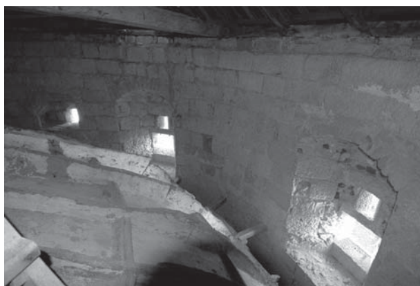
Kapela sv. Križa, potkrovlje apside / Chapel of the Holy Cross, apse area substructure