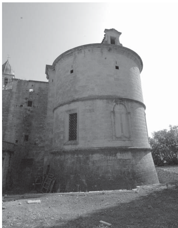
Kapela sv. Križa, pogled na apsidu / Chapel of the Holy Cross, view of the apse area