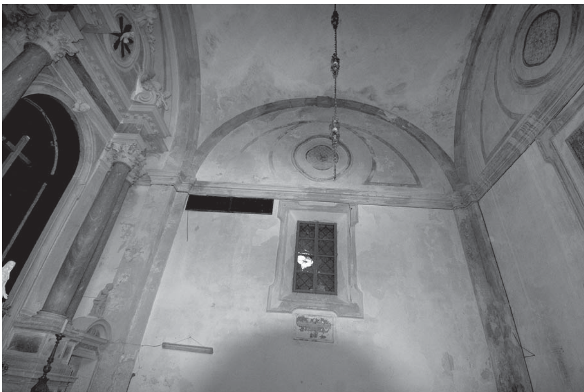
Kapela sv. Križa, unutrašnjost / Chapel of the Holy Cross, interior