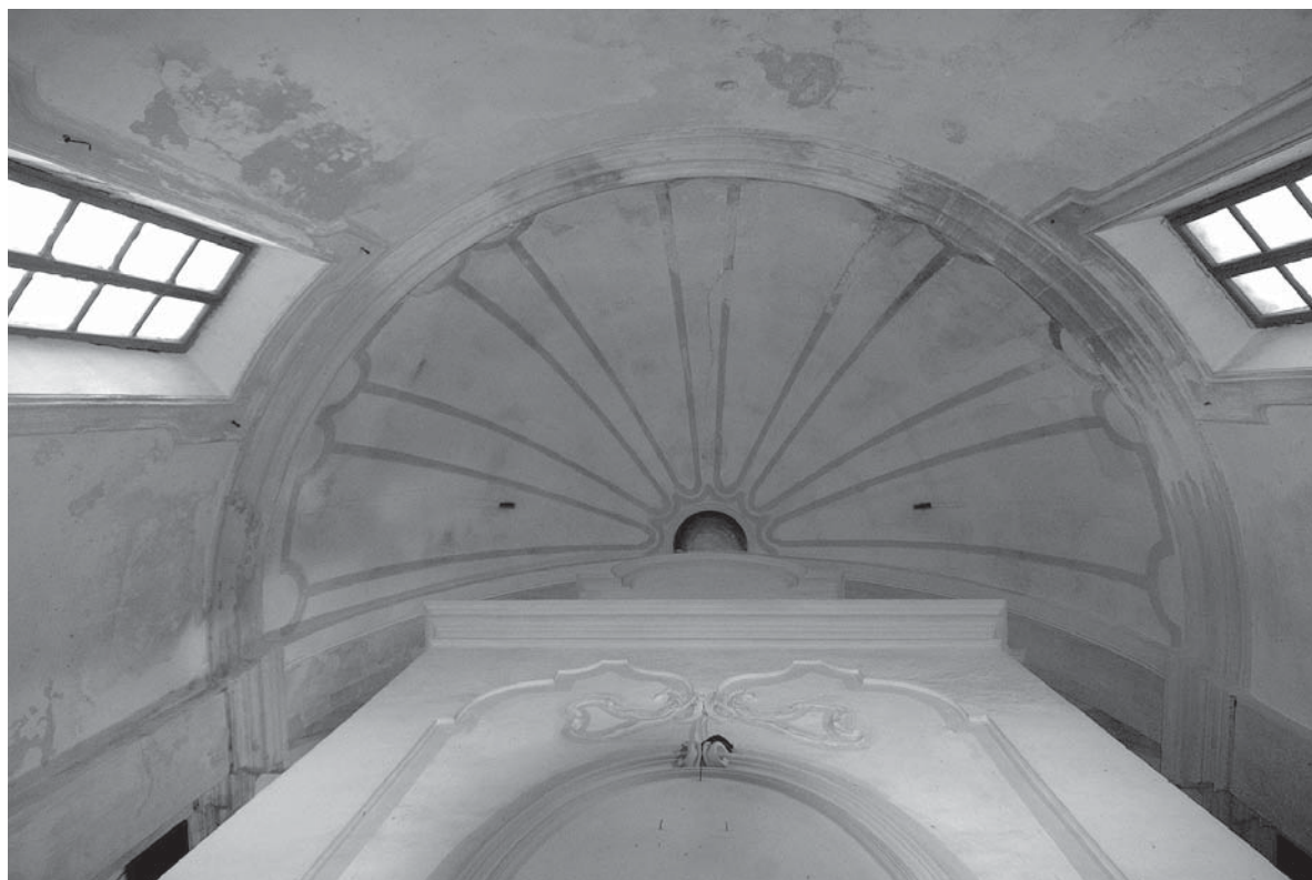
Kapela sv. Križa, svod apside / Chapel of the Holy Cross, apse arch

gradnje kapele Massarijev projekt pojednostavljen tako da su izostavljeni ili promijenjeni pojedini arhitektonski elementi 10 . Tu mogućnost ipak treba otkloniti jer se ne mogu raspoznati nespretnosti i »šavovi« u strukturi zidne površine koji bi bili posljedica izostavljanja pojedinih dijelova zidne plastike. Jedino bi se moglo pretpostaviti da su izostavljani kapiteli na ugaonim ojačanjima u brodu kapele te da su umjesto pilastara oblikovane lezene. Međutim ni ta mogućnost nije vjerojatna jer bi nosači s kapitelima, dakle pilastri ili polustupovi, pretpostavljali postojanje gređa, a ne vijenca koji sada nosi lezene. Ako bismo išli korak dalje i pokušali vijenac zamijeniti gređem, odmah bismo ustanovili da je razmak između donjeg, pravokutnog i gornjeg četveroliznog prozora suviše uzak za njihovu postavu. Za takva sažimanja provedena tijekom izgradnje morali bi se promijeniti odnosi mnogih projektom predviđenim mjera, što bi značilo da su graditelji bili sposobni uspješno »reinterpretirati« Massarijevu vrlo osobitu i pomno razrađenu projektantsku zamisao. Iznesene pretpostavke o promjenama koje su se dogodile između projekta i izgrađenog, a potom odmah i njihovo odbacivanje može se činiti suvišnim, no cilj njihova provjeravanja je pokazati kako Massarijev projekt dosljedno proveden tijekom izgradnje, što je osobite važno za određenje značaja kapele Sv. Križa u ukupnom opusu ovog arhitekta.