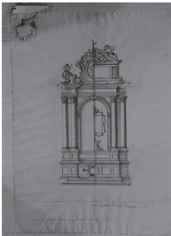
Prvi crtež s projektom oltara / First altar design sketch