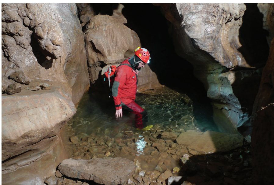
Početak hidrološki aktivnog djela špilje