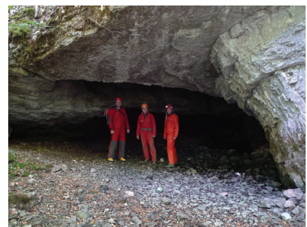
Ulaz u špilju

Od T15 počinje dio špilje koji je stalno hidrološki aktivan, a njegov je smjer pružanja prema jugoistoku. Od spomenute točke potrebno je ispenjati se računajući s dubinom jezera 2 m i isto se toliko spustiti u kanal koji je do svojega krajnjeg djela i sifona dugačak 14 m. Ispod spusta postoji sifon dubine 4 m koji se podvlači pod spomenuti kanal. Na 5 m prije kraja potrebno je ponovno ispenjati se iz vode 1 m, gdje se dolazi u paralelno jezero nepoznate dubine. Iznad jezera