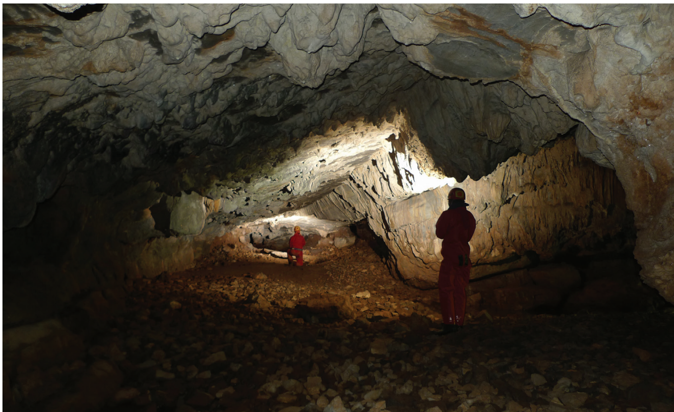
Jugoistočni kanal

je dimnjak visine 10 m. Iz jezera kanal nastavlja dalje prema zapadu. Nakon ulaza u njega počinje se pojavljivati vodeni tok. Nakon 14 m kanal mijenja smjer prema sjeveru a duljina mu je 13 m. Ovdje nestaje vodeni tok odnosno počinje dublja voda (1 m) i kanal ponovo kreće prema zapadu. Tu počinje dvoronica 7 x 5 m sa sifonskim jezerom, iz kojega na jugozapad kreće suhi kanal s tri kraća odvojka. Ujedno je to i kraj špilje. Od sifonskog jezera do izlaza vode na površinu, odnosno izvora Crno vrelo ima 10-ak metara.