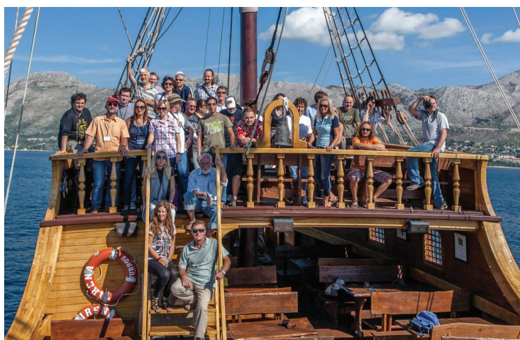
Skupna fotografija sudionika simpozija