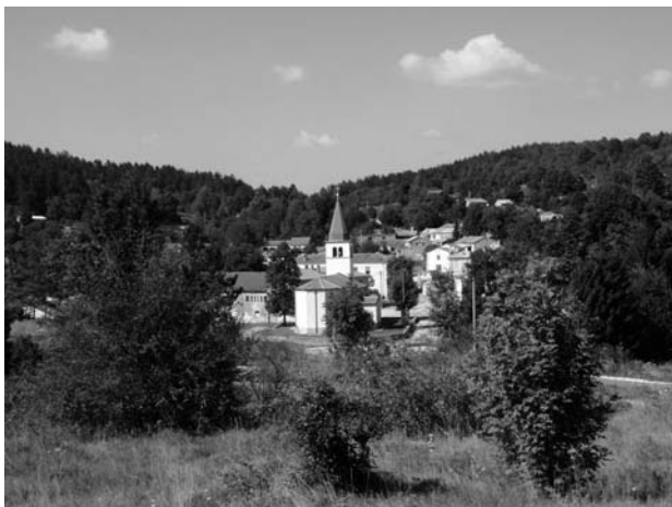
Sl. 1. Panorama Velih Muna s prilazne ceste

Žitelji se uglavnom bave poljoprivredom i stočarstvom za vlastite potrebe, a dio njih se zbog posla preselio u Rijeku i okolicu.