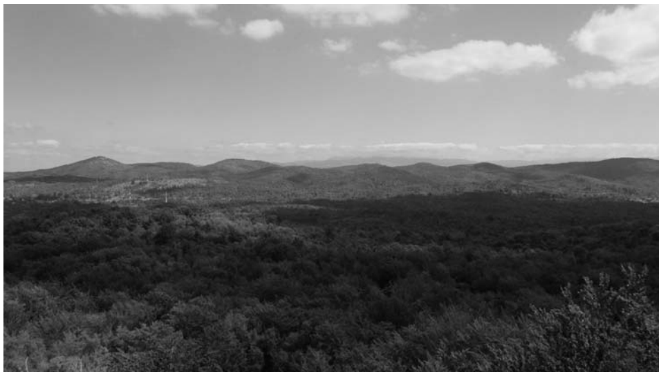
Sl. 7. Panorama s vrha Taborina prema sjeveroistoku

o početku gradnje bila je pobuna munskih seljaka zbog poskupljenja soli u prosincu 1584. godine, kojom je vješto manevrirala mletačka obavještajna služba. Time su se ugrozile obrambene pozicije i osjećaj sigurnosti unutarjoaustrijske uprave na tom području koje je Mletačka Republika do 1752. godine ionako smatrala svojim teritorijem. 44