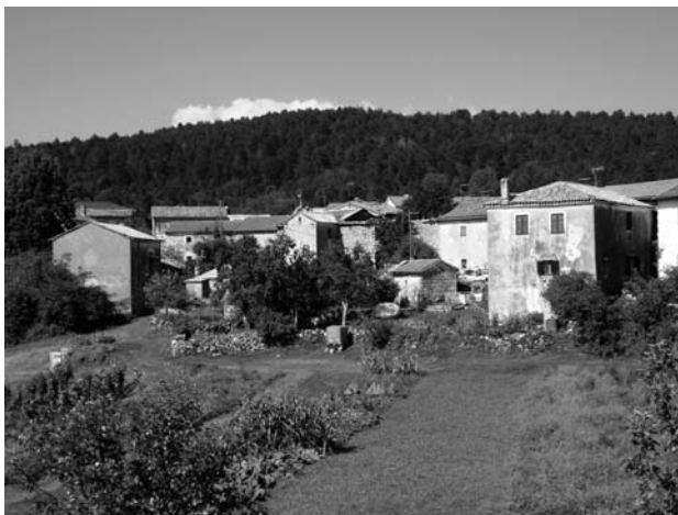
Sl. 2. Pogled na dio Malih Muna

Tragovi o naseljenosti tog područja u prapovijesti i antici nisu istraženi. U srednjem vijeku Mune su pripadale akvilejskom patrijarhu, potom grofovima Goričkim, a 1394. godine osvajaju ih Mlečani. Tada se naselja uključuju u Rašporsku gospoštiju te su zabilježena u njezinu urbaru. Mune su dosta stradale u mletačko-ugarskim ratovima (1411. – 1420.), pa su se već tada na opustjela područja naseljavali vlaški stočari iz Dalmatinske zagore i