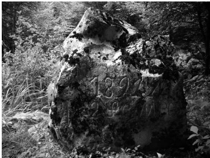
Sl. 5. Granični kamen iz 1891. godine uz stari put od Malih Muna do Račje Vasi (foto: Slaven Bertoša)