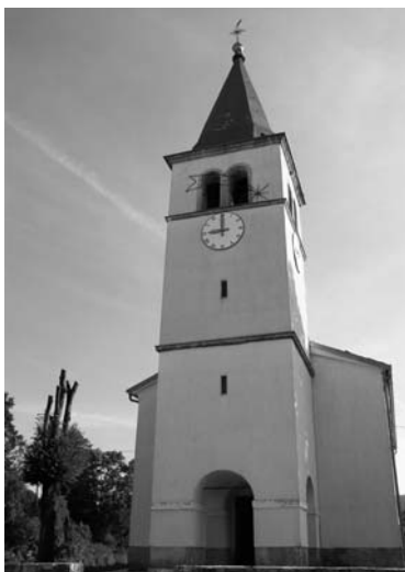
Sl. 3. Crkva sv. Marije Magdalene u Velim Munama