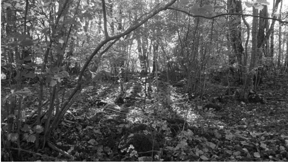
Sl. 10. Današnje stanje lokacije nekadašnjega Mnskoga grada

Munski je grad postojao 31 godinu. Uništen je 30. studenog 1616. godine u Uskočkom ratu između Venecije i Austrije. Razaranje navode izvješća rašporskog kapetana i mletačkog viceprovidura u Istri Bernarda Tiepola prvo od 4. rujna 1618. godine 51 i drugo nedatirano, sastavljeno i poslano vladi u Mletke po završetku rektorove 35-mjesečne službe. 52