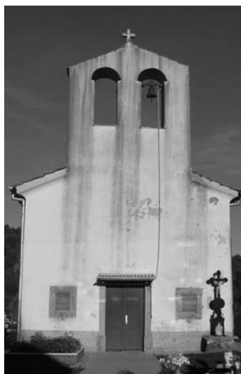
Sl. 4. Crkva Sv. Križa na mjesnom groblju