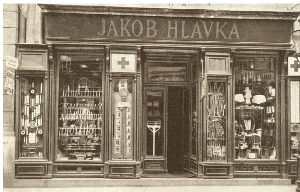
Slika 3. Prodavaonica medicinskih instrumenata Jakob Hlavka