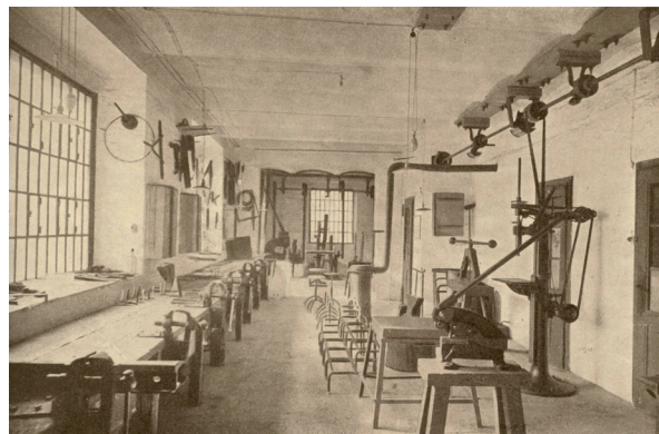
Slika 2. Tvornica medicinskih instrumenata smještena u Ilici 31

U susjednoj kući, u Ilici 29 bile su smještene prodavaonica i skladište (slika 3 i 4). Tvornica je nosila ime "Prva hrvatska tvornica kirurških instrumenata, bandagah, orthopädskih sprava, umjetnih protheza, zavojne robe i.t.d."