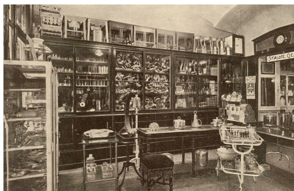
Slika 4. Unutrašnjost prodavaonice medicinskih instrumenata Jakob Hlavka

Uz navedeno, proizvodio je i metalno pokućstvo (stolove za operacije i preglede, ormare za pohranu instrumenata i lijekova, bolesničke krevete i noćne ormariće, stolce, radne stoliće za opremu ambulanti i ordinacija, sterilizatore i dr.), radi čega je u tvornici imao i posebnu kovačnicu (slika 5), prostoriju za niklovanje i bakrenje, a u skladištu je držao također gumenu i staklenu robu (sonde, katetere, štrcaljke, epruvete i dr.).