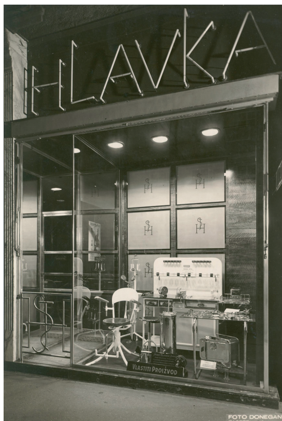
Slika 7. Nova prodavaonica smještena u Ilici 24

65 majstora - kirurških mehaničara, ortopedskih mehaničara, bravara za pokućstvo, kovinotokara, brusaa, bandažista. Instrumenti i uređaji proizvodili su se ručno, bili su izrađeni od najbolje vrste štajerskoga čelika ( extra-hart i halb-hart ), gotovo jednake kvalitete kao švedski. Svjestan gospodarstvene situacije u predratnoj Jugoslaviji, Hlavka je uređaje davao na otplatu omogućujući mladim liječnicima povoljnije uvjete za osamostaljenje u vlastitim ordinacijama. Iako su između dva svjetska rata niknula i druga poduzeća, kao što su "Jugoslavanski medicinski depo A.D.", "Jugoslavensko Siemens A.D." i dr., sve su ovo bila poduzeća za uvoz medicinske opreme pa će Hlavkina tvornica ostati i dalje kao jedina proizvodna tvrtka ovakve vrste u tadašnjoj Jugoslaviji koja je opremanje zdravstvenih ustanova učinila nezavisnim od inozemstva.