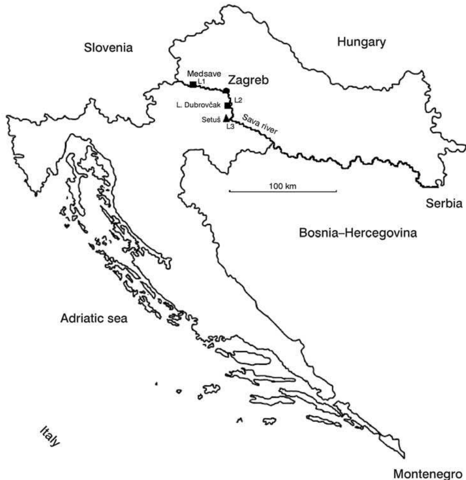
Slika 1. Mjesta uzorkovanja Fig 1: Sampling locations

U srednjem toku Sava je tipična brza nizinska rijeka, a njezino je dno u području Medsava uglavnom šljunkovito, u području Lijevo Dubrovcaka pjeskovito, a Setuša muljevito (Slika 1).