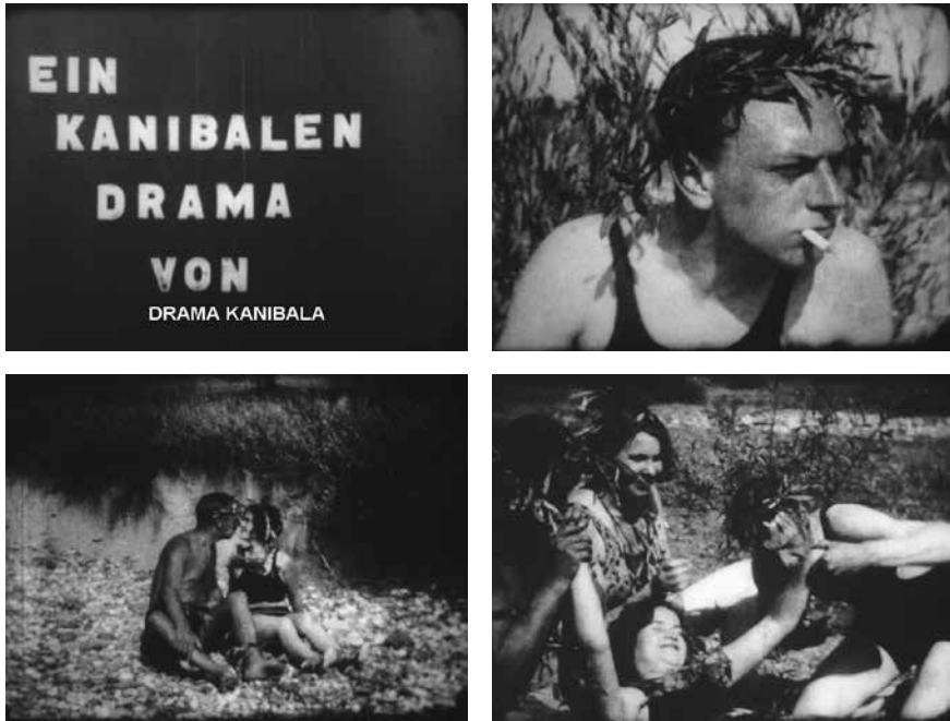
Slika 6. Vernakularna izvedba žanra: Kralj Tobu Wabobu je gladan (1930) ili “rustikalna parodija o ljudožderima, smještena na sprudove Save”.

interes za eksperiment kulminira u parodijskoj gradskoj simfoniji Zagreb u svjetlu velegrada .