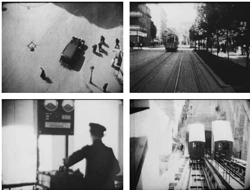
Slika 1. Znakovi modernizacije i velegrada u filmu Zagreb 1936 .

filma nije poznat, no smatra se da je “velika vjerojatnost da je snimatelj ovog predratnog dokumentarca bio Marko Graf koji je kamerom zabilježio sve što je smatrao važnim u gradu: od Hrvatskog narodnog kazališta do Glavnog kolodvora; od Meštrovićevog Josipa Juraja Strossmayera ispred zgrade HAZU do zagrebačke katedrale; od Sveučilišta do Mirogojskih arkada” (Lhotka 2011: 4). Film uvodi gradski album snimkom Mirogoja, što je znakovito jer se poslije u filmu oko tog motiva razvija i kraća narativna digresija o temi moderniteta. U spomenuti konvencionalni katalog znamenitosti sličan Paspinu, kada stignemo do kadrova željezničkog kolodvora i futurističke mreže tračnica, umeću se starije snimke Zagreba s početka stoljeća, koji se opisuje blago nostalgичnim tonom i kontrastira sa znakovima vremena (npr. rušenje starog Dolca i izgradnja novog). 18 Istovremeno se filmski medij dovodi u vezu s ranijim formama popularne zabave, kontek-