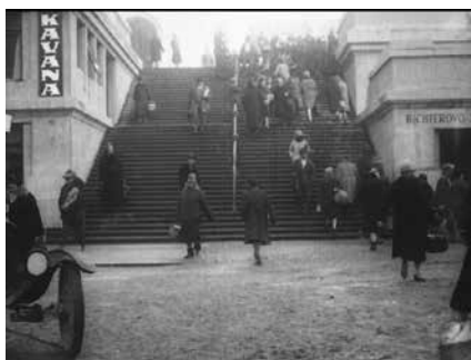
Slika 2. Znakovi modernizacije i velegrada u filmu Zagreb i njegove znamenitosti .

stom sajmišta i pripadajućih atrakcija, uz tekst: “I tamo... gdje smo kao djeca – prije dvadeset i više godina gledali... gledali stare panorame i njihaljke... i gdje su se održavali čuveni kraljevski i margaretski sajmovi... danas se podižu ponosne palače posljednjeg decenija.” Na modernu arhitekturu nastavlja se na prvi pogled tipičan prizor kopanja temelja za nove zgrade, 19 no bliži