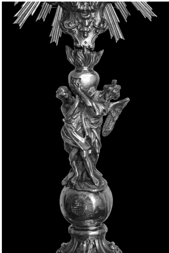
5. Nodus pokaznice Marcantonia Napolitana s kraja 18. stoljeća, župna crkva sv. Stjepana u Luci Šipanskoj / Nodus of Marcantonio Napolitano's monstrance, late 18 th century, parish church of St Stephen in Luka Šipanska