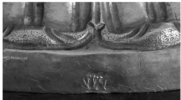
6. Zlatarski žig Marcantonio Napolitana na rubu baze / Hallmark of Marcantonio Napolitano on the edge of the base