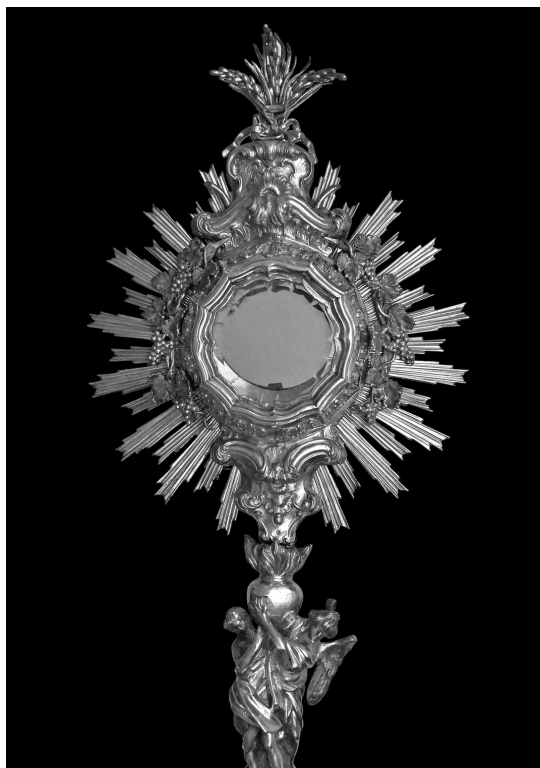
4. Gornji dio pokaznice Marcantonia Napolitana s kraja 18. stoljeća, župna crkva sv. Stjepana u Luci Šipanskoj / Upper part of Marcantonio Napolitano's monstrance, late 18 th century, parish church of St Stephen in Luka Šipanska