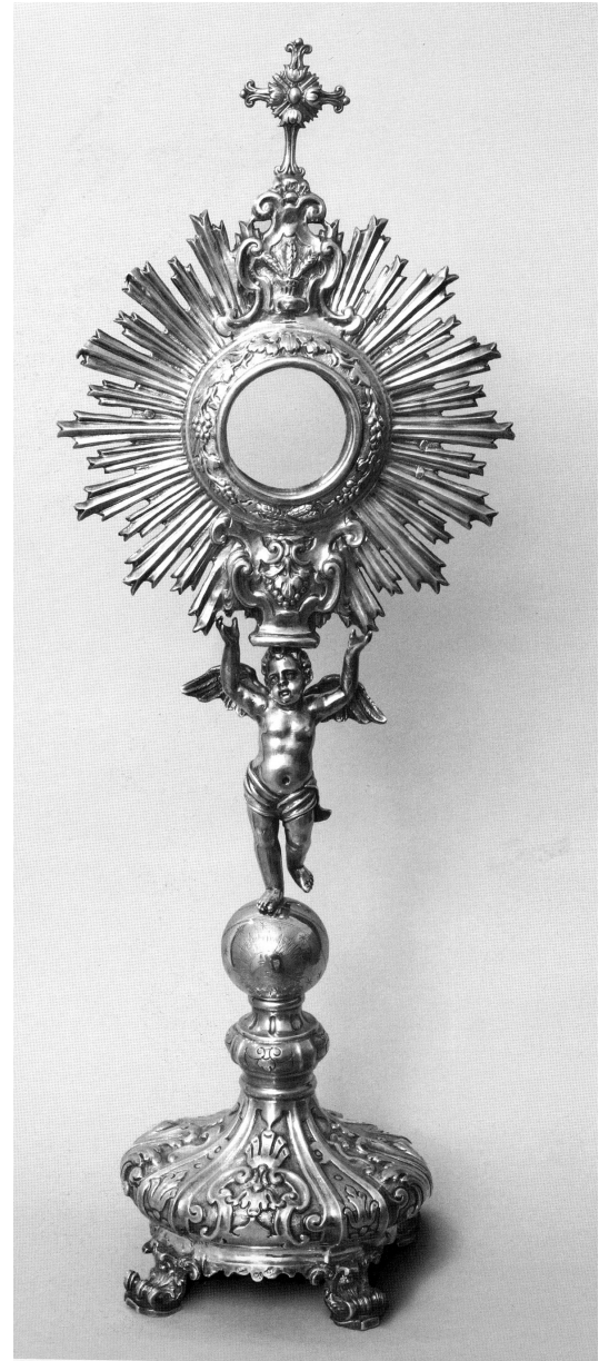
2. Cristoforo Mellino, pokaznica, 1742., Motta Montecorvino, crkva San Giovanni Battista / Cristoforo Mellino, monstrance, 1742, Motta Montecorvino, Church of San Giovanni Battista

jetnina na kojima je barok iskazao svu svoju dinamiku. U prvoj polovici 18. stoljeća intenzivan je utjecaj francuskog zlatarstva – tzv. stila rocaille za vrijeme Luja XV. Zlatarstvo u Napulju odlikuje dinamizam i širina likovnih motiva. 4 U razvoju zrakastih pokaznica iskazuje se nazočnost kartuša i fitomorfnih motiva euharistijske simbolike. Baza je često ukrašena kontrapostiranim volutama i izražene je piramidalne strukture. Nodus je najčešće oblikovan u obliku mikroskulpture postavljene na zemaljskoj kugli, fluidne forme, koja nosi techu sa stiliziranim sunčevim zrakama raznih formi i dimenzija. Unutar skupine zrakastih pokaznica