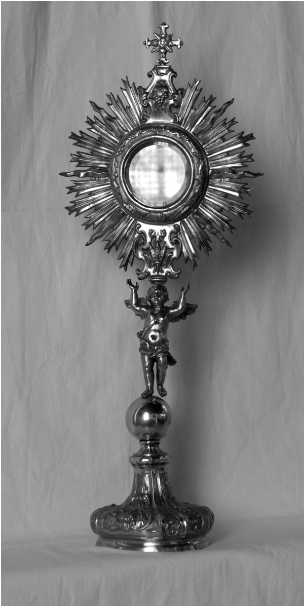
1. Napuljski zlatar, pokaznica iz samostana Sigurata u Dubrovniku (foto: B. Gjukić) / Neapolitan master, monstrance from the Sigurata monastery in Dubrovnik (photo: B. Gjukić)

1a. Napuljski zlatar, donacijski natpis Bratovštine kovača 13. XII. 1744 na bazi pokaznice iz Samostana Sigurata u Dubrovniku (foto: B. Gjukić) / Neapolitan goldsmith, donation inscription of the Confraternity of blacksmiths dated 13 th December 1744 on monstrance base from the Sigurata monastery in Dubrovnik (photo: B. Gjukić)