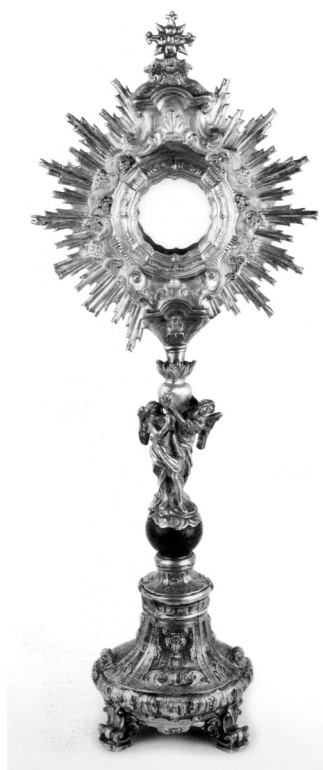
8. Pokaznica nepoznatog napuljskog zlatara, Lucera, Museo diocesano / Unknown Neapolitan goldsmith, monstrance, Lucera, Museo diocesano