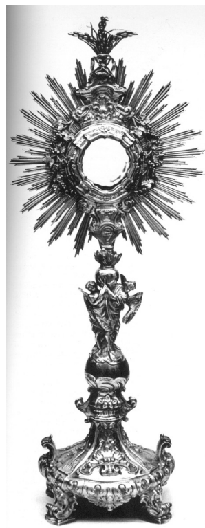
7. Filippo Cavaliera (?), Pokaznica, 1780. (Castelnuovo Monterotarto, crkva San Pietro e San Nicolo di Bari) / Filippo Cavaliera (?), monstrance, 1780, Castelnuovo Monterotarto, Church of San Pietro e San Nicolo di Bari