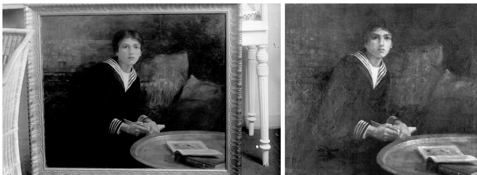
1. Nasta Rojc, Sanjarenje , ulje na platnu, 1911., lijevo: reproducirano iz negativa, desno presnimka slike iz kataloga izložbe 1997. / Nasta Rojc, Daydreaming , oil on canvas, 1911, left: reproduced from original negative, right: painting reproduced in the 1997 exhibition catalogue