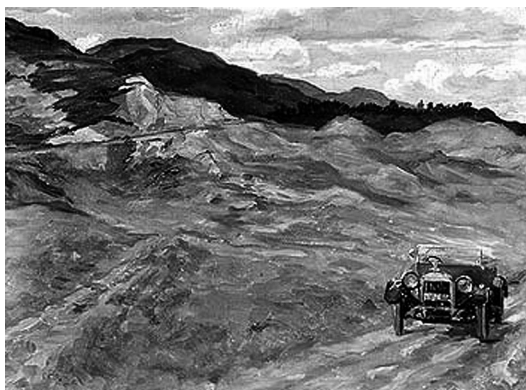
9. Nasta Rojc, Naš auto u Škotskoj , ulje na platnu, 1925. / Nasta Rojc, Our car in Scotland , oil on canvas, 1925.