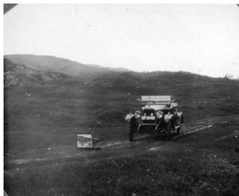
10. Automobil , oko 1925. (foto: Nasta Rojc) / Nasta Rojc, Car , c. 1925, photograph

kroničnoj bolesti koja ju je onemogućila u studiranju te pripretila slikaričinu životu 1908. godine, bila odlučna da završi studij slikarstva što i čini 1910. godine. 25