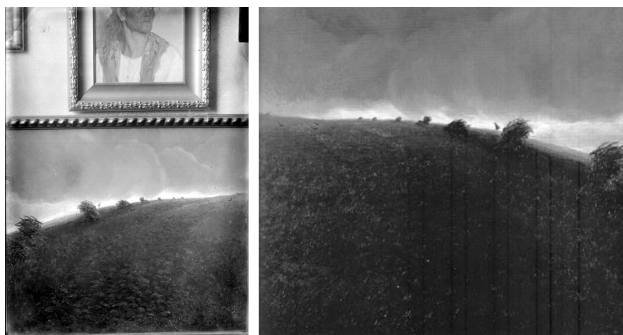
6. Nasta Rojc, Putnik , ulje na platnu, 1911., lijevo: reproducirano iz negativa, desno presnimka slike iz kataloga izložbe, 1997. / Nasta Rojc, Traveller , oil on canvas 1911, left: reproduced from original negative, right: painting reproduced in the 1997 exhibition catalogu

kom je tata govorio, a ono slanine na zelje nije mi se činilo za životno zadovoljstvo potrebnim.